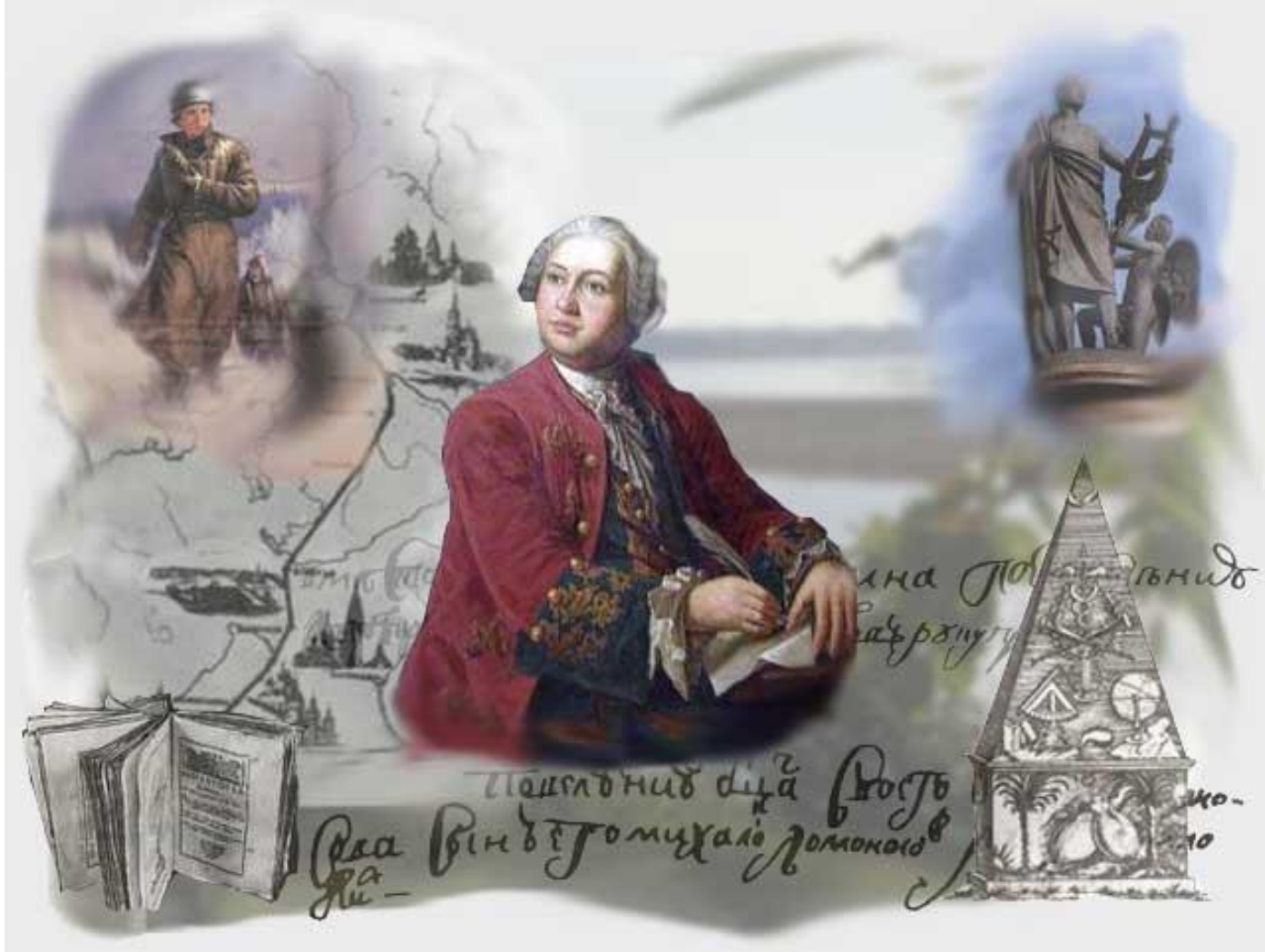
Ломоносов Михаил Васильевич 1711г.-1765г.