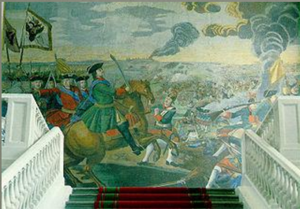
«Полтавская баталия». Мозаика М. В. Ломоносова в здании Академии Наук. Санкт-Петербург. 1762—1764