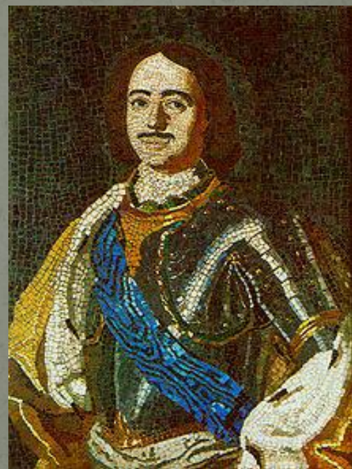
Портрет Петра I. Мозаика. Набрана М. В. Ломоносовым. 1754. Эрмитаж