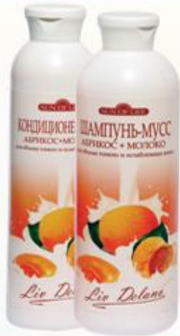
«Абрикос + молоко» Шампунь-мусс и Кондиционер-мусс для объема тонких и ослабленных волос