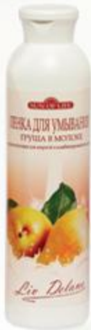
Пенка для умывания «Груша в молоке» нормализующая для жирной и комбинированной кожи