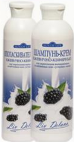
«Ежевично-кефирный» Шампунь-крем и Кондиционер-крем для укрепления выпадающих, ослабленных или «усталых» волос