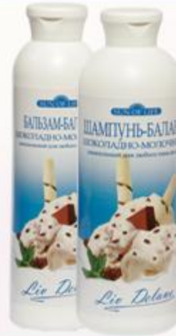
«Шоколадно-молочный» Шампунь-баланс и Бальзам-баланс питательный для любого типа волос