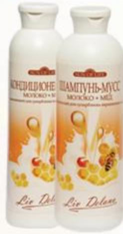
«Молоко + мёд» Шампунь-мусс и Кондиционер-мусс оживляющий для суперблеска окрашенных волос