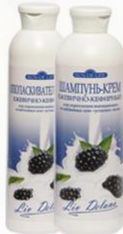
«Ежевично-кефирный» Шампунь-крем и Кондиционер-крем для укрепления выпадающих, ослабленных или «усталых» волос