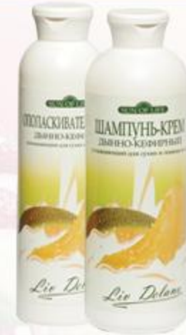
«Дынно-кефирный» Шампунь-крем и Ополаскиватель-крем увлажняющий для сухих и ломких волос