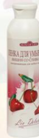
Пенка для умывания «Вишня со сливками» омолаживающая для любого типа кожи