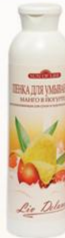
Пенка для умывания «Манго в йогурте» восстанавливающая для сухой и чувствительной кожи