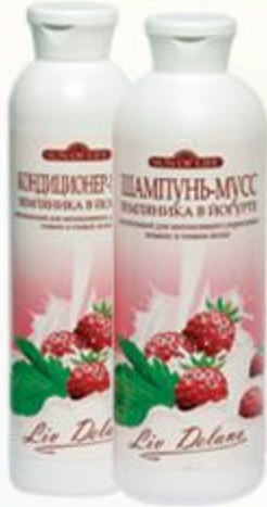
«Земляника в йогурте» Шампунь-мусс и Кондиционер-мусс питательный, для интенсивного укрепления ломких и тонких волос