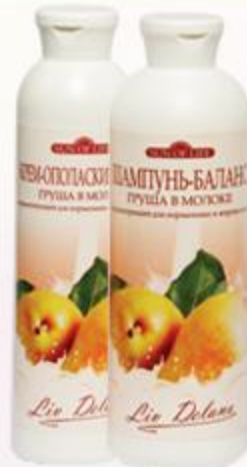
«Груша в молоке» Шампунь-баланс и Крем-ополаскиватель нормализующий для нормальных и жирных волос