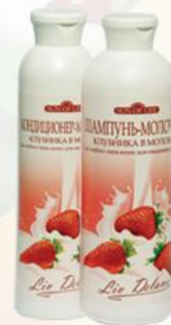
«Клубника в молоке» Шампунь-молочко и Кондиционер-молочко для любого типа волос и ежедневного ухода