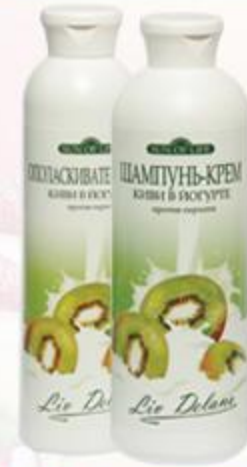
«Киви в йогурте» Шампунь-крем и Ополаскиватель-крем против перхоти