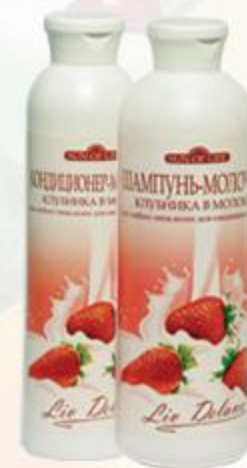
«Клубника в молоке» Шампунь-молочко и Кондиционер-молочко для любого типа волос и ежедневного ухода