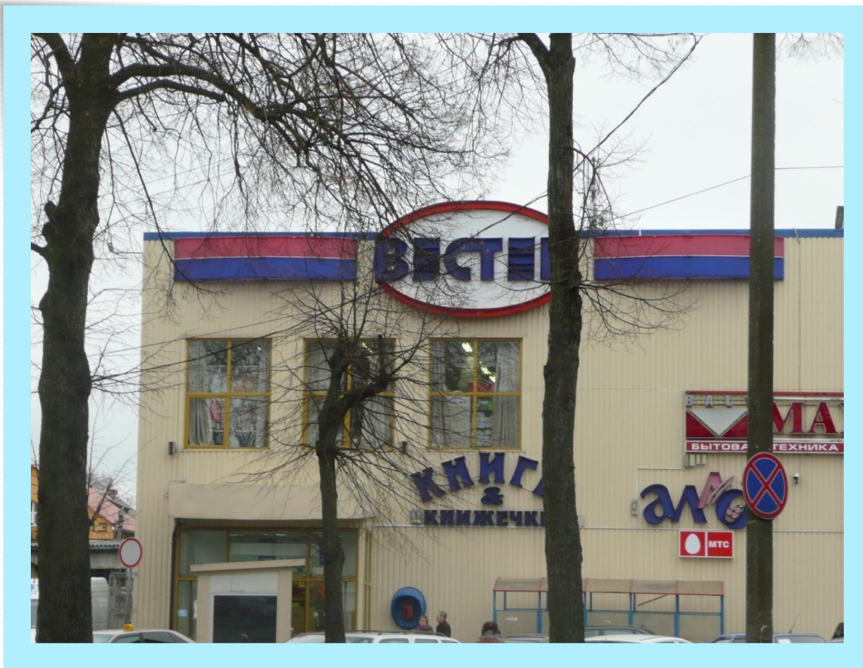
Торговый центр «Вестер»