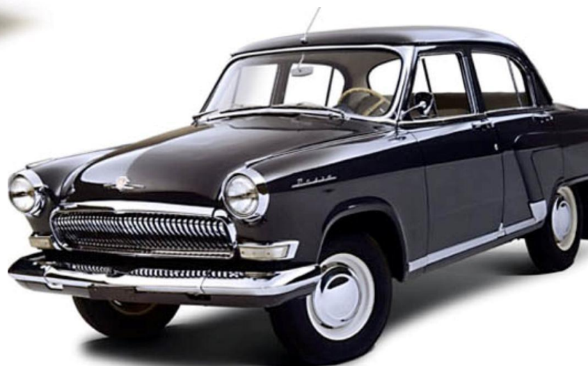
Служебные машины Волга ГАЗ-21