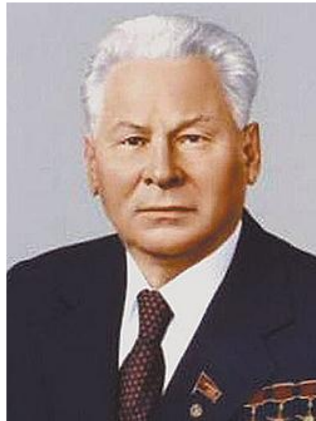
Леонид Ильич Брежнев; Юрий Владимирович Андропов; Константин Устинович Черненко.