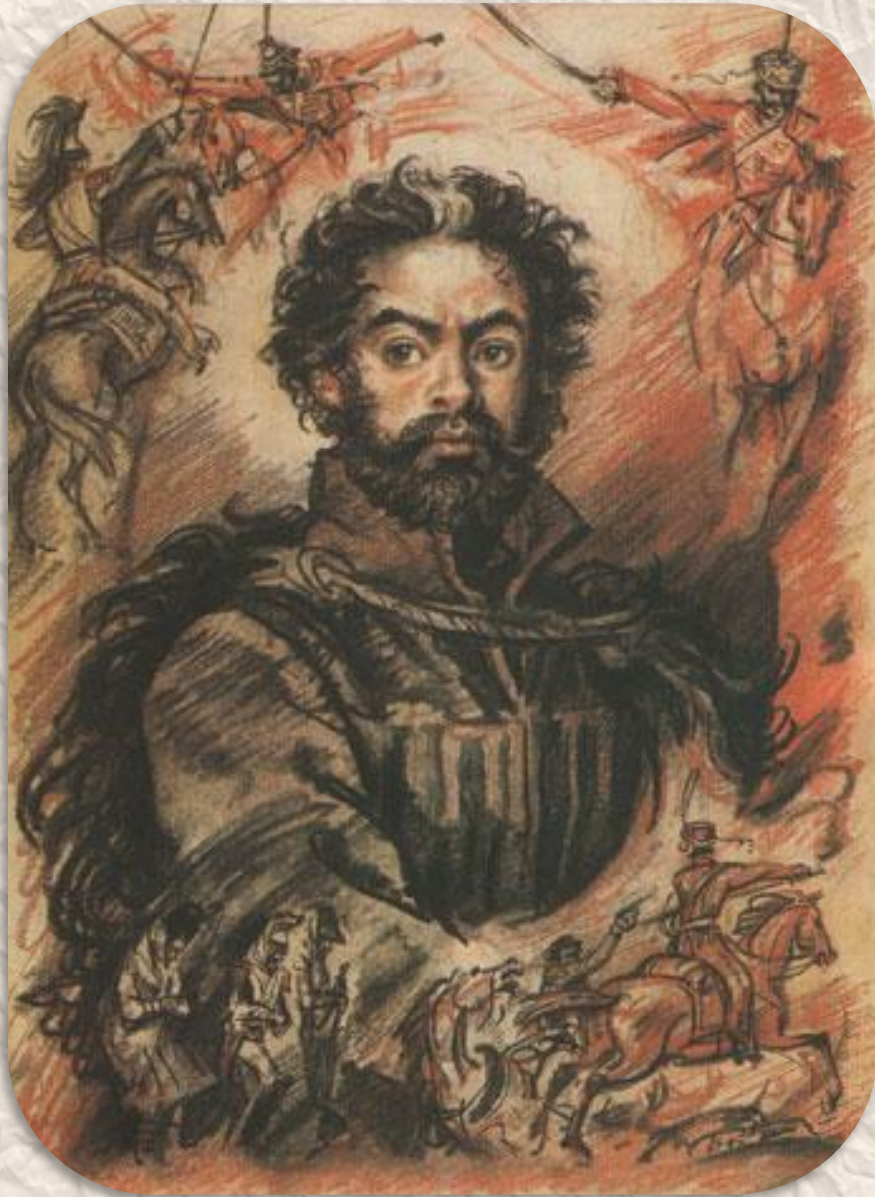
Денис Васильевич Давыдов