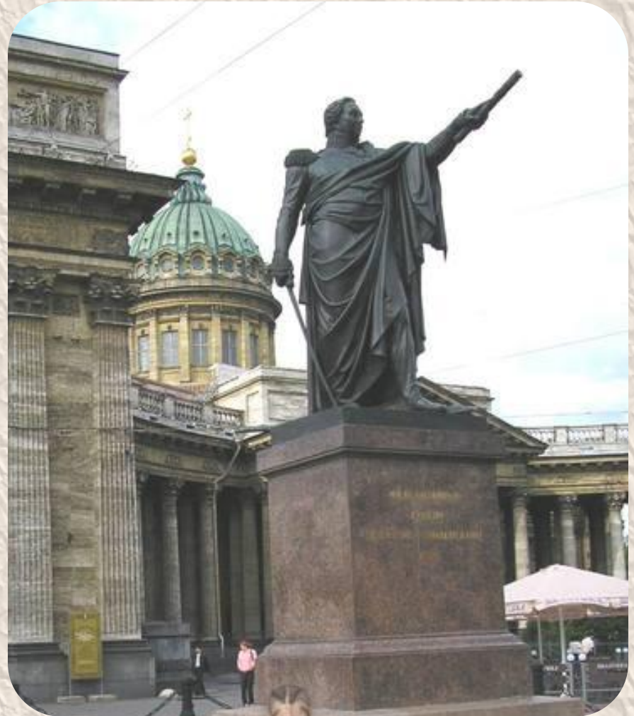
Памятник Кутузову около Казанского собора.