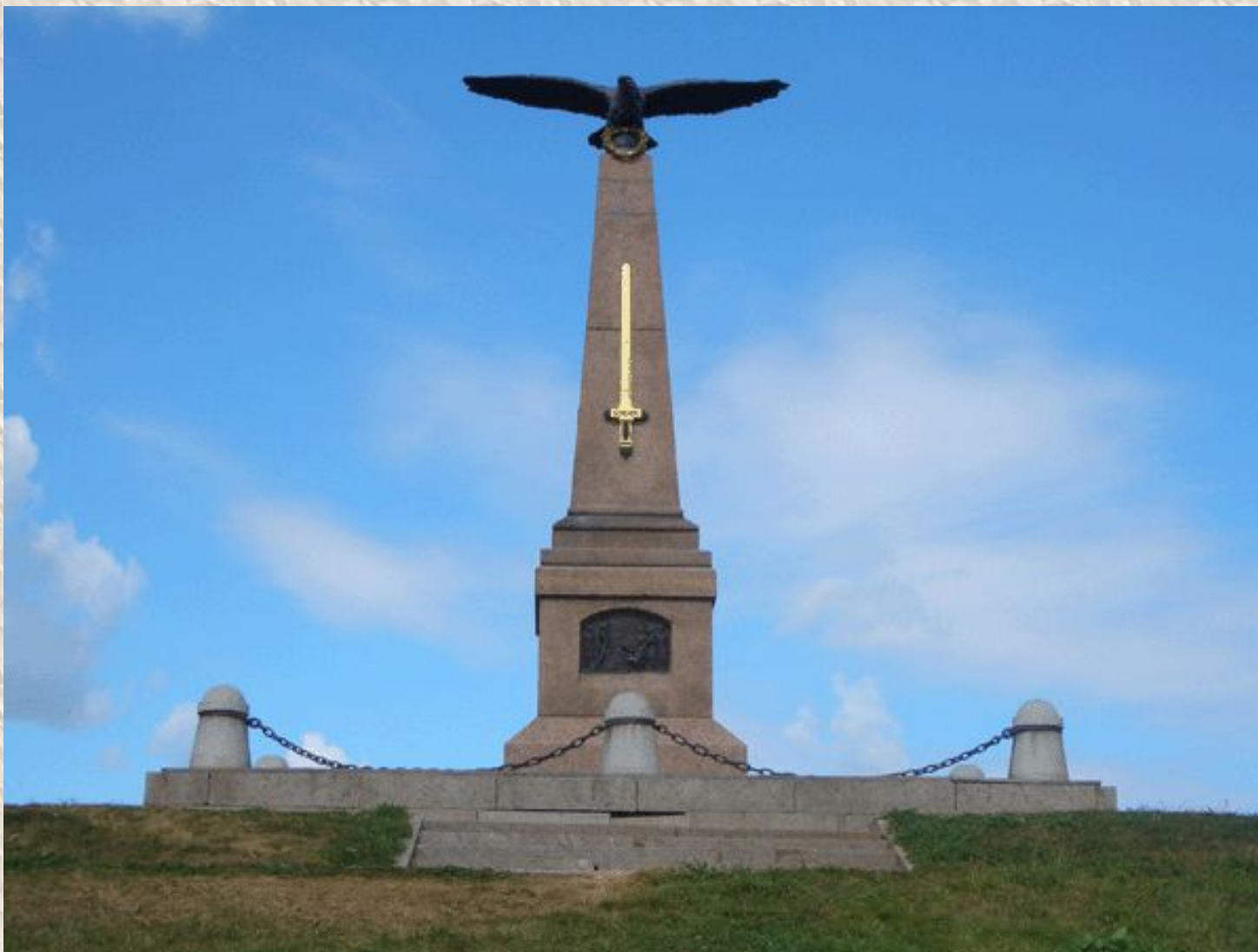
Памятник русским воинам на Бородинском поле.