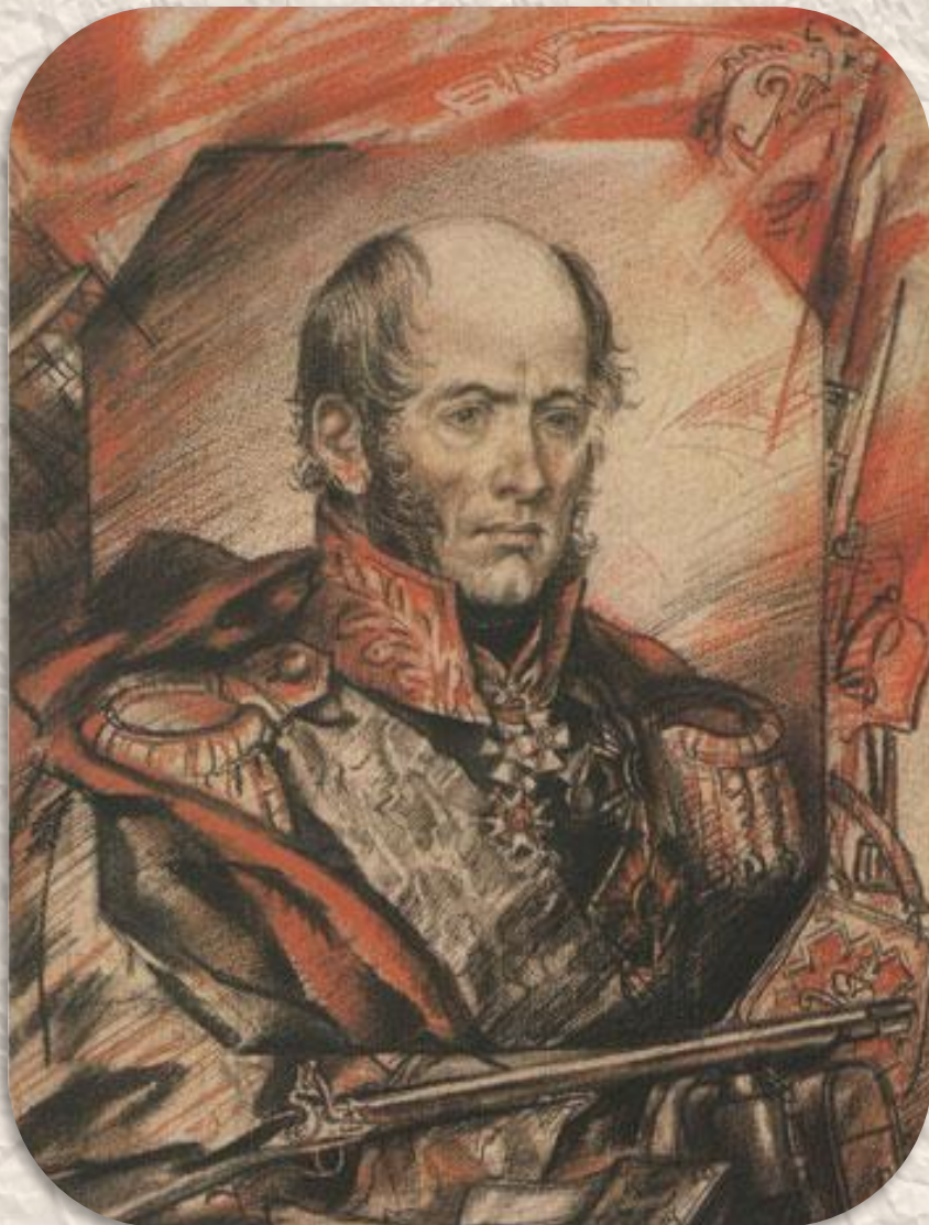
Михаил Богданович Барклай де Толли