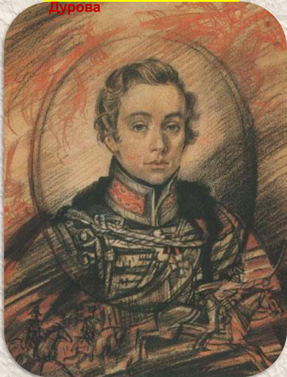
Надежда Андреевна Дурова