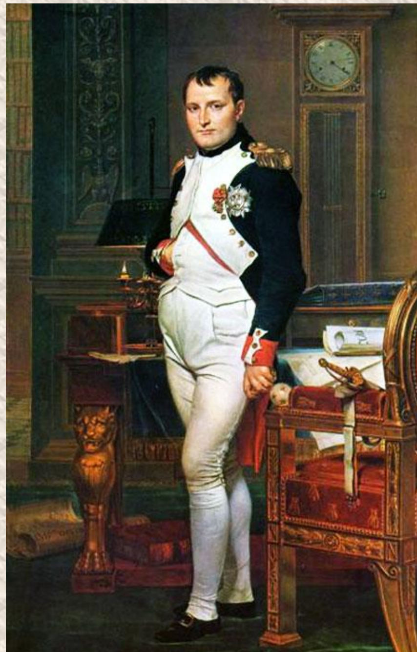
Ж.Л. Давид. Наполеон в своём

12 июня 1812 года громадная французская армия вторглась в Россию. Началась Отечественная война русского народа против захватчиков.