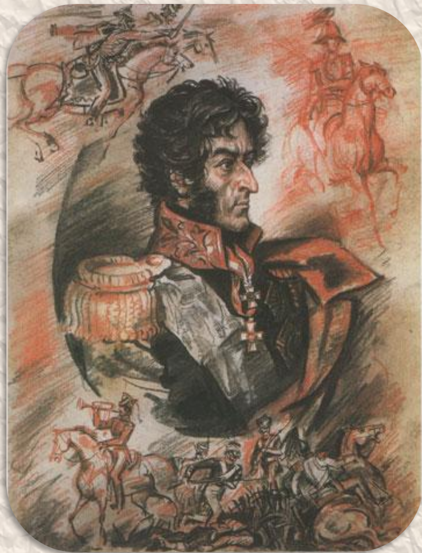
Пётр Иванович Багратион