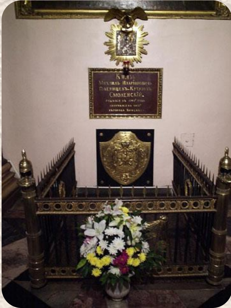
Могила М. И. Кутузова в Казанском соборе.