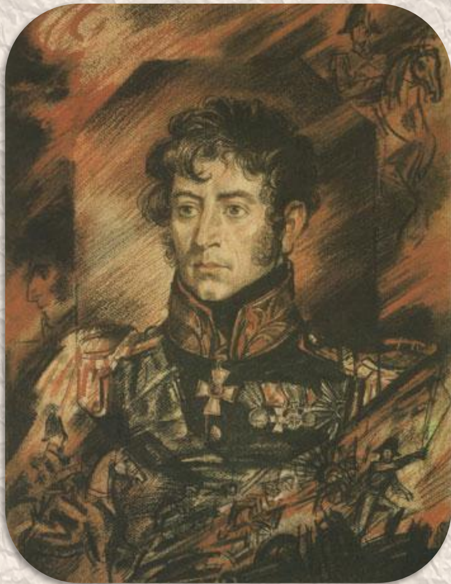
Михаил Андреевич Милорадович