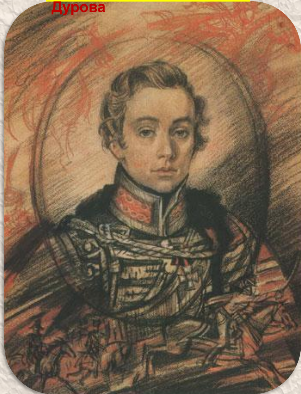
Надежда Андреевна Дурова