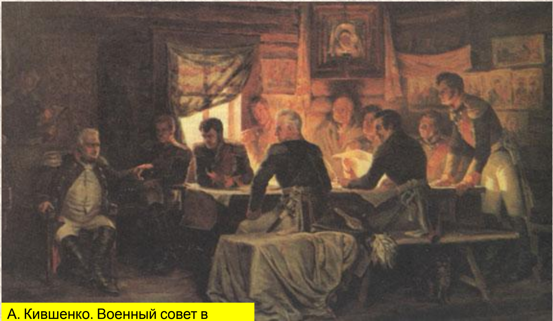
А. Кившенко. Военный совет в