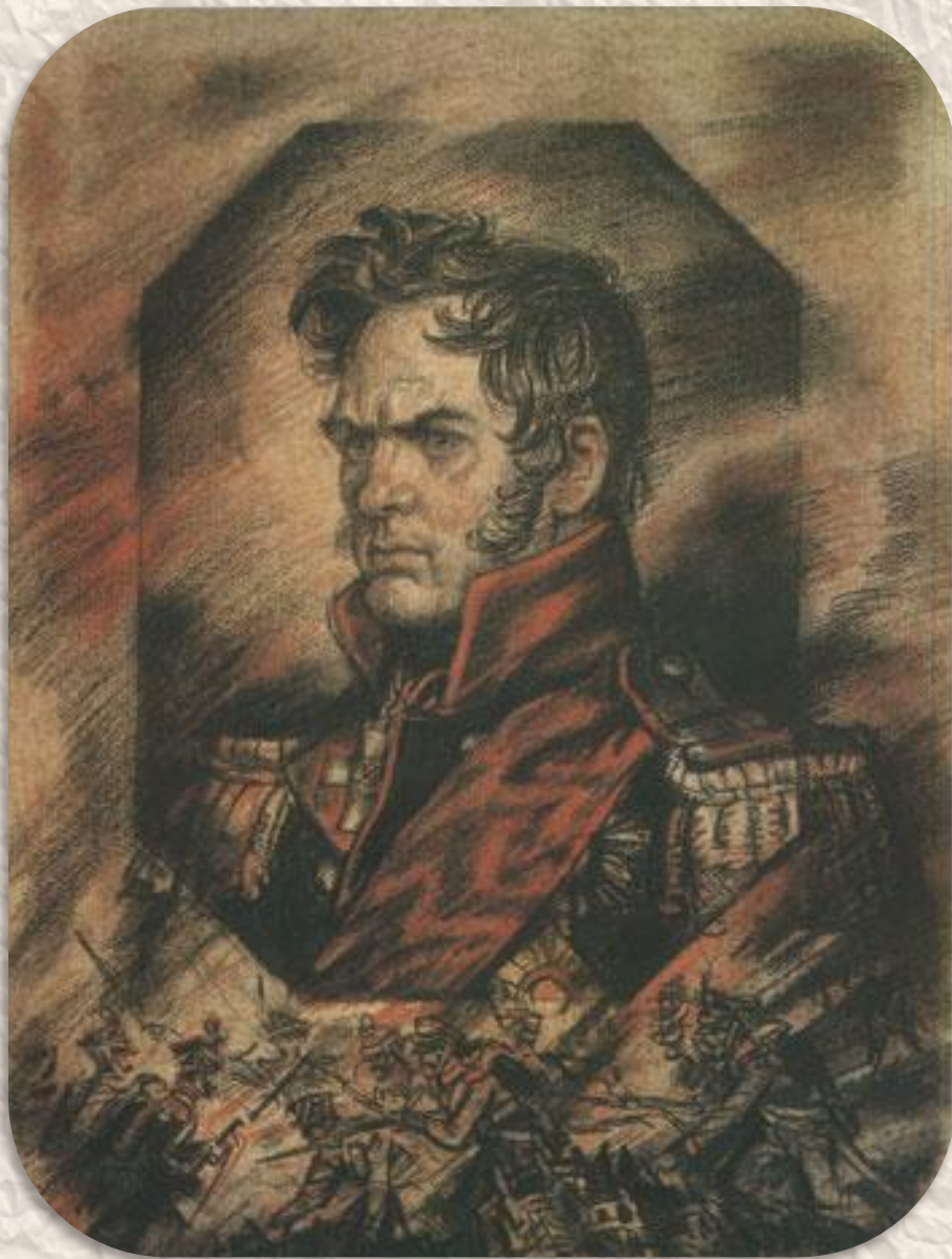
Алексей Петрович Ермолов