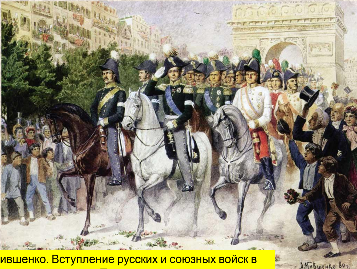
А. Кившенко. Вступление русских и союзных войск в Париж.

В 1814 году русские войска и их союзники вошли в Париж. Так закончилась попытка поставить Россию на колени.