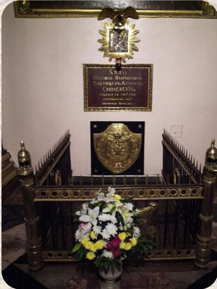
Могила М. И. Кутузова в Казанском соборе.