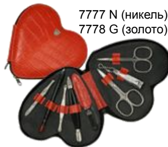
7777 N (никель) 7778 G (золото)