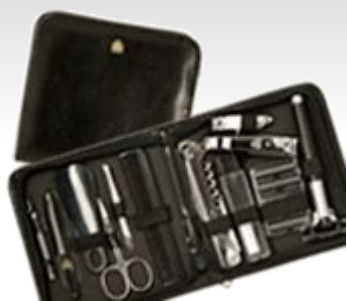
Дорожный набор для мужчин. 6335 N