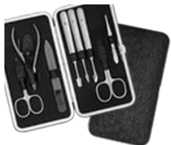
7802 N-MATT CUT