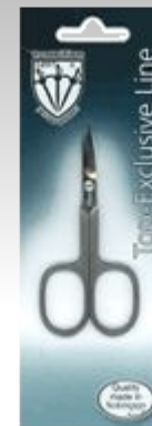
Маникюрные ножницы EL 9904