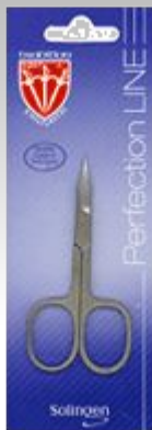
Маникюрные ножницы PF 2004 N