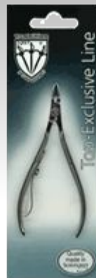
Кусачки для кожи EL 9437-10 CM