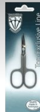
Маникюрные ножницы EL 9904