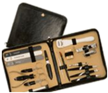
Дорожный набор для мужчин. 9310 N CUT