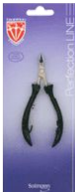
Кусачки для кожи PF 2033 N