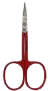
SB 1803 N