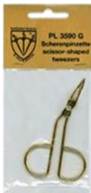
Пинцет для бровей.