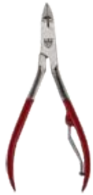
FU 2431 N