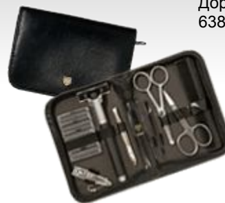
Дорожный набор для мужчин. 6385 N