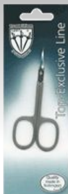
Маникюрные ножницы EL 9903