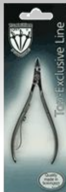
Кусачки для кожи EL 9437-10 CM