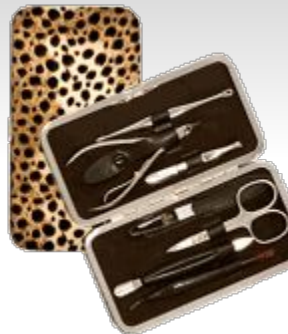
56214 N CUT