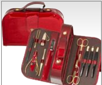
Кейс для маникюра (лакированный)

Футляры из актуальнейших модных материалов