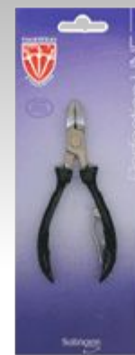
Кусачки для ногтей PF 2032 N