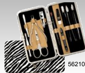
56210 N CUT