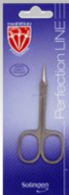
Маникюрные ножницы PF 2003 N