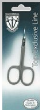
Маникюрные ножницы EL 9903