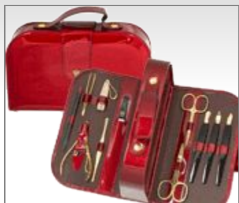
Кейс для маникюра (лакированный)

Футляры из актуальнейших модных материалов