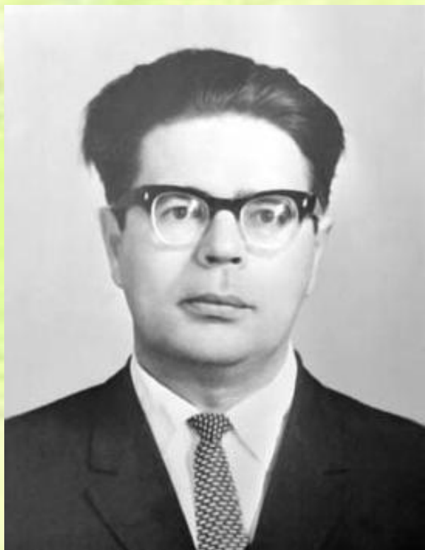
Михаил Иванович Каргаполов – выпускник Каргапольской средней школы, член- корреспондент Академии наук СССР, всемирно известный математик, лучший алгебраист мира.