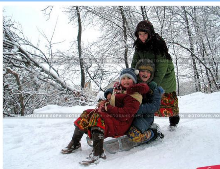
Зимние забавы