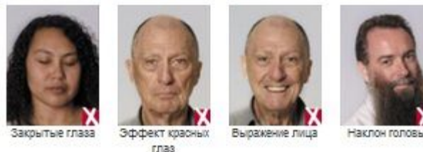
Фото: файл не выбран