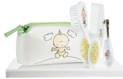
Детский набор «Счастливый малыш» код 79295

Мочалка-рукавичка сшита в форме двухслойного мешочка (снаружи – двухсторонняя махровая ткань, внутри трикотаж) из 100% хлопка в белом цвете. Верхний край мочалки обшит трикотажем с петелькой для подвешивания. Размер мочалки-рукавички: 12 см х 19 см. Мочалка-рукавичка предназначена для детей до 3-х лет.