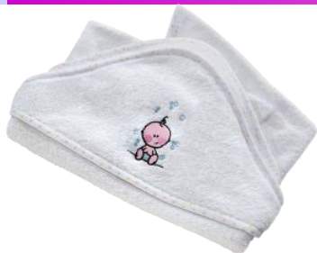
Детское полотенце «Счастливый малыш» код 67534

Полотенце детское махровое с двух сторон . Полотенце выполнено в белом цвете. Предназначено для детей до 3-х лет. Материал: 100% хлопок. Размеры: ширина 70 см, длина 64 см. Уголочек-капюшон: 30х30см.