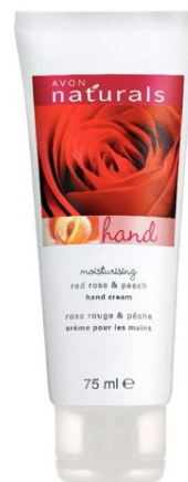
Крем для рук «Красная роза и Персик» серии Naturals код 79128

Эффективно увлажняет и смягчает кожу рук.