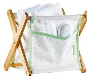
Корзинка для аксессуаров «Счастливый малыш» код 70961

В состав набора входят: щетка (щетина выполнена из нейлона), расчёска- однорядка (пластик); щипчики для ногтей (углеродистая сталь); косметичка-футляра (полиуретан на тканевой основе), которая закрывается на молнию, имеет ручку - петельку. Размер футляра: 16 см х 6,5 см х 6,5 см.