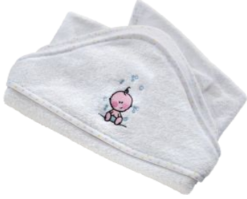
Детское полотенце «Счастливый малыш» код 67534

Полотенце детское махровое с двух сторон . Полотенце выполнено в белом цвете. Предназначено для детей до 3-х лет. Материал: 100% хлопок. Размеры: ширина 70 см, длина 64 см. Уголочек-капюшон: 30х30см.