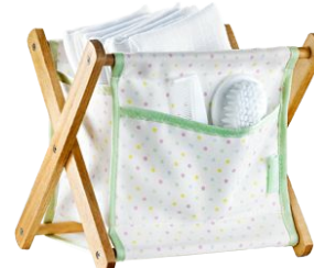
Корзинка для аксессуаров «Счастливый малыш» код 70961

В состав набора входят: щетка (щетина выполнена из нейлона), расчёска- однорядка (пластик); щипчики для ногтей (углеродистая сталь); косметичка-футляра (полиуретан на тканевой основе), которая закрывается на молнию, имеет ручку - петельку. Размер футляра: 16 см х 6,5 см х 6,5 см.