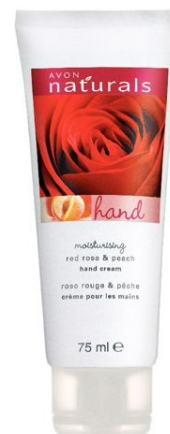
Крем для рук «Красная роза и Персик» серии Naturals код 79128

Эффективно увлажняет и смягчает кожу рук.