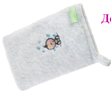
Детская мочалка-рукавичка «Счастливый малыш» код 66931

Полотенце детское махровое с двух сторон . Полотенце выполнено в белом цвете. Предназначено для детей до 3-х лет. Материал: 100% хлопок. Размеры: ширина 70 см, длина 64 см. Уголочек-капюшон: 30х30см.