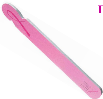
Пилочка для ногтей «Розовая лента» код 70960

Пилочка для ногтей двухсторонняя и состоит из пяти слоев.