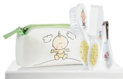
Детский набор «Счастливый малыш» код 79295

Мочалка-рукавичка сшита в форме двухслойного мешочка (снаружи – двухсторонняя махровая ткань, внутри трикотаж) из 100% хлопка в белом цвете. Верхний край мочалки обшит трикотажем с петелькой для подвешивания. Размер мочалки-рукавички: 12 см х 19 см. Мочалка-рукавичка предназначена для детей до 3-х лет.