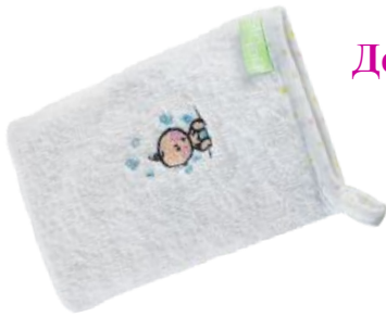
Детская мочалка-рукавичка «Счастливый малыш» код 66931

Полотенце детское махровое с двух сторон . Полотенце выполнено в белом цвете. Предназначено для детей до 3-х лет. Материал: 100% хлопок. Размеры: ширина 70 см, длина 64 см. Уголочек-капюшон: 30х30см.