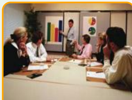
Работа с раздаточным материалом