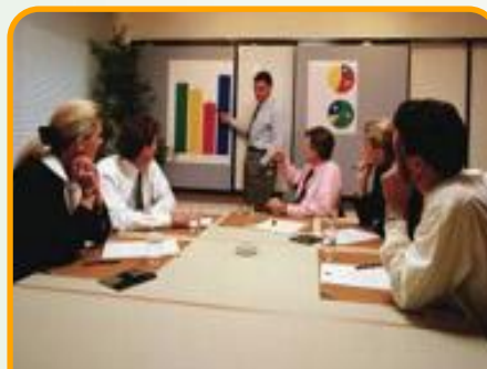
Работа с раздаточным материалом