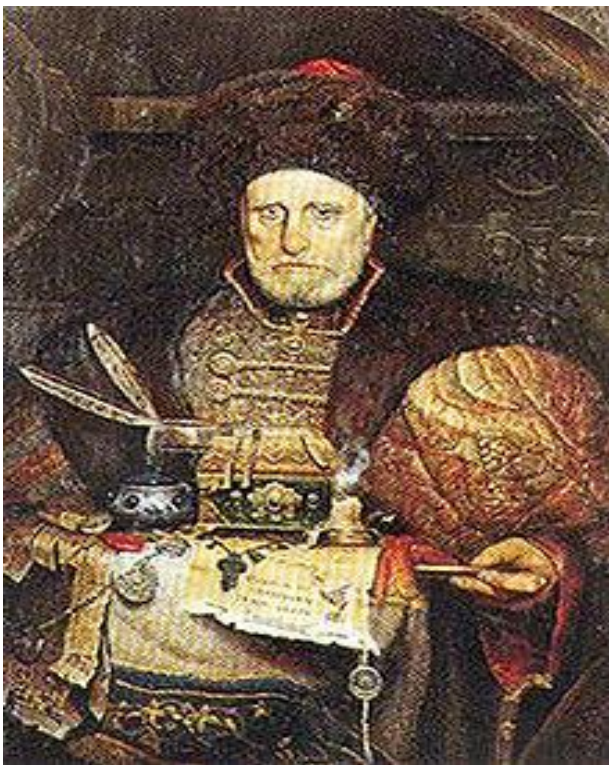
Курбский Андрей Михайлович

Таких « Опасных типов » можно выделять из общей массы персонала еще на стадии первичного собеседования.