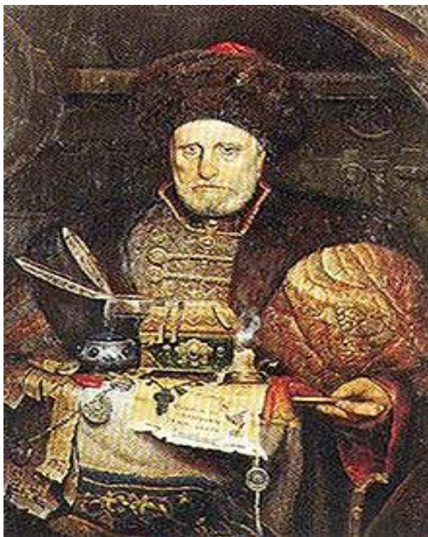
Курбский Андрей Михайлович

Таких « Опасных типов » можно выделять из общей массы персонала еще на стадии первичного собеседования.