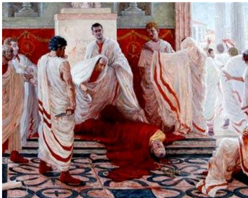
Брут Марк Юний