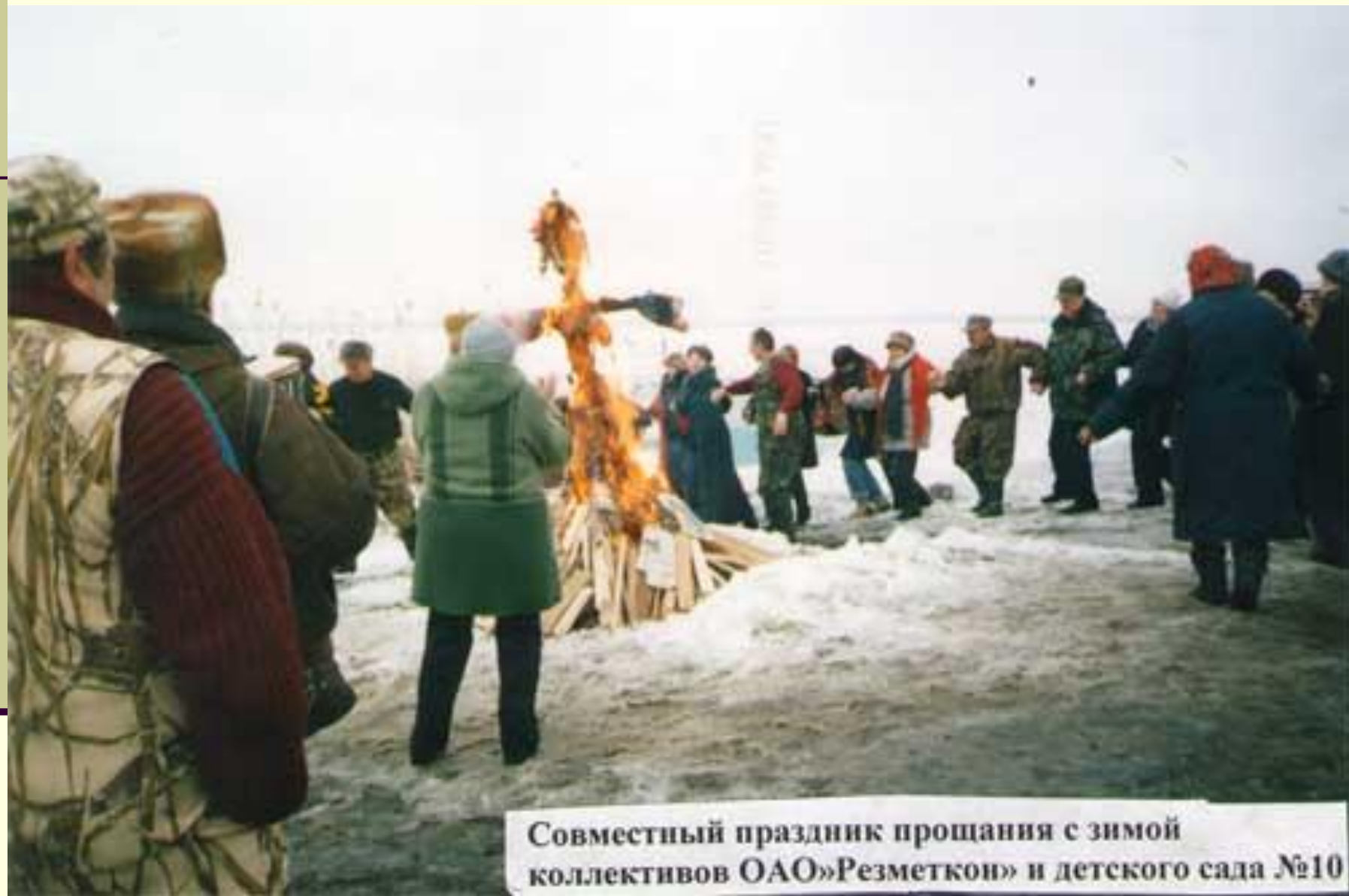
Совместный праздник прощания с зимой коллективов ОАО «Резметкой» и детского сада №10