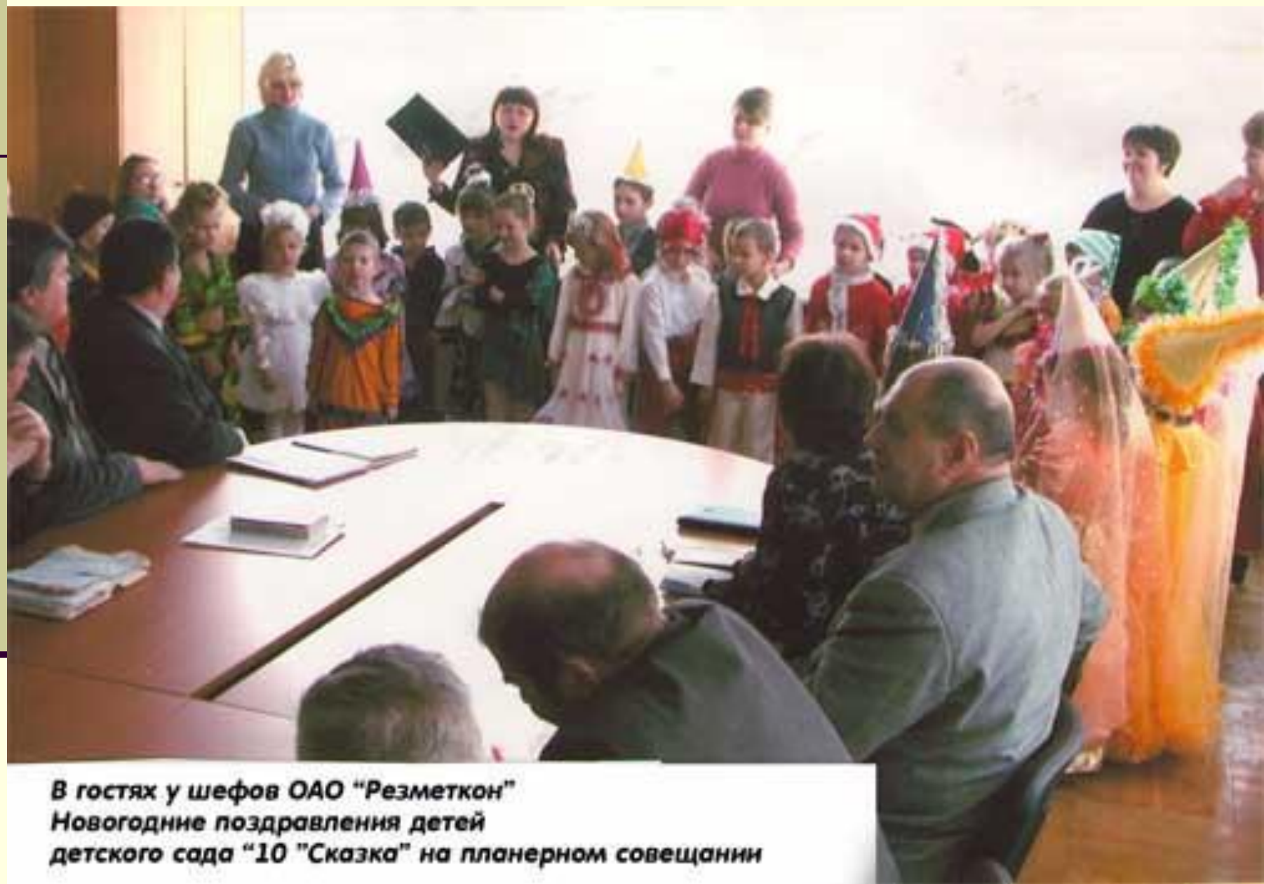
В гостях у шефов ОАО "Резметкон" Новогодние поздравления детей детского сада "10 "Сказка" на планерном совещании