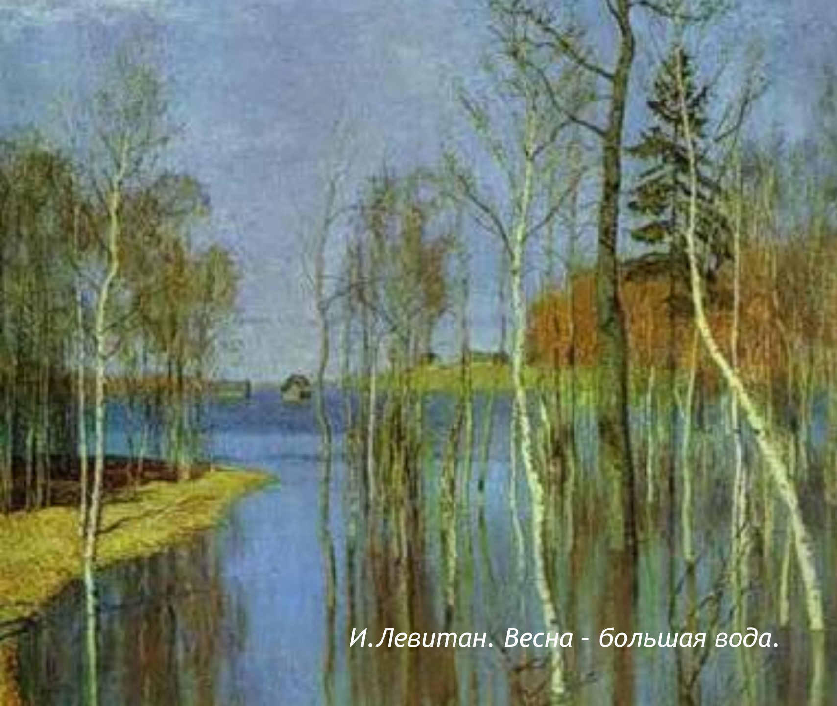
И. Левитан. Весна - большая вода.