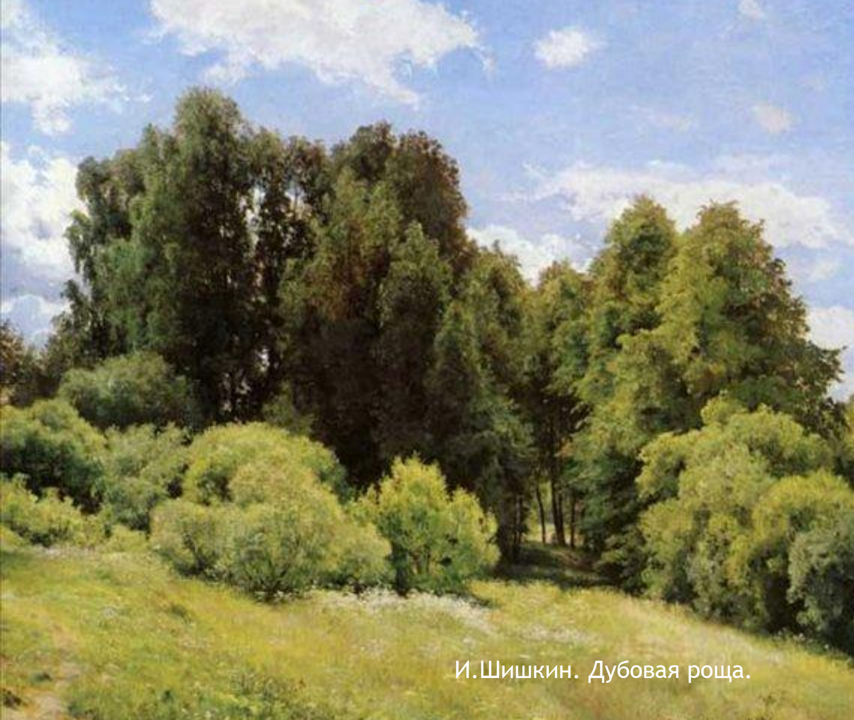
И.Шишкин. Дубовая роща.