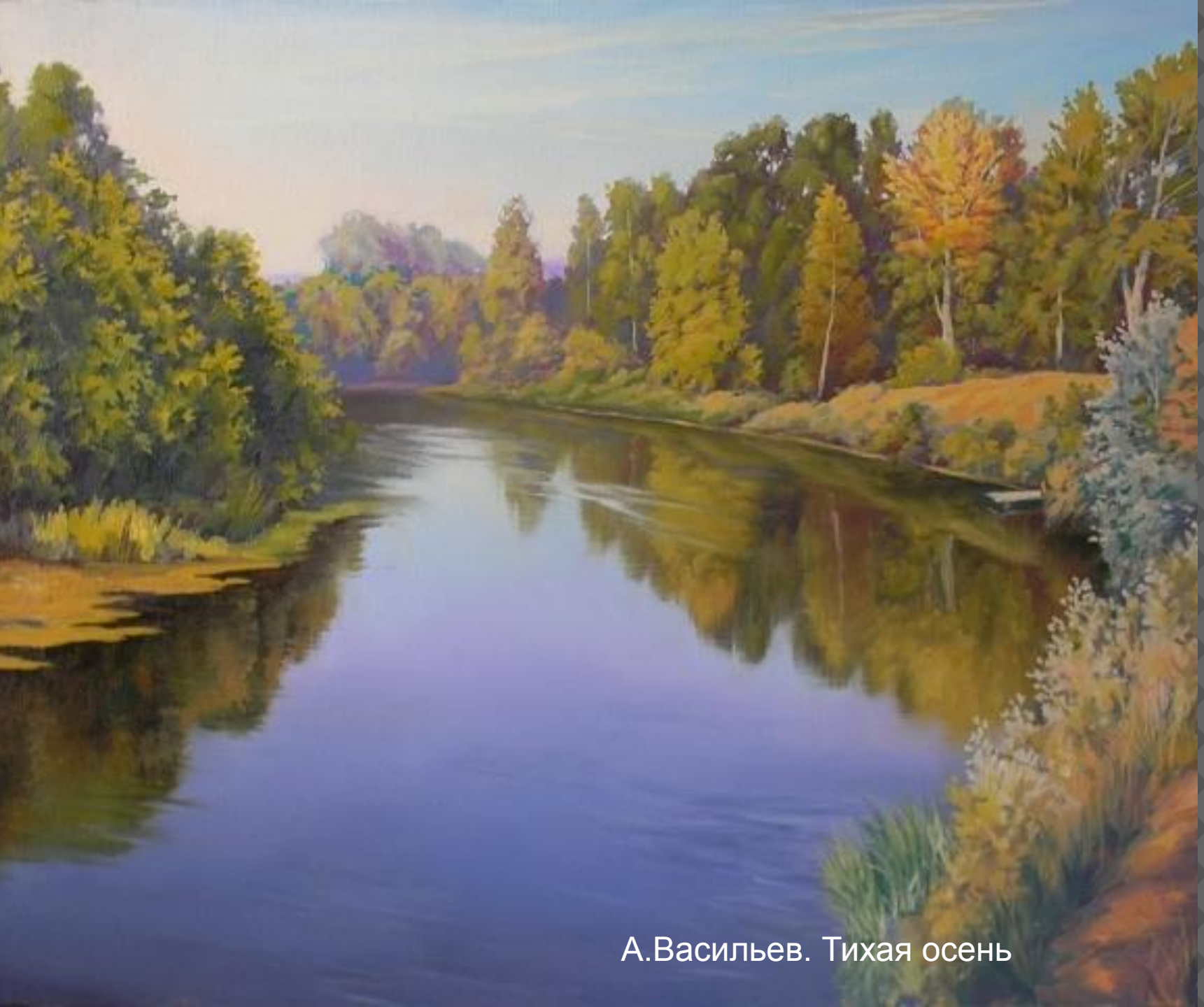
А.Васильев. Тихая осень