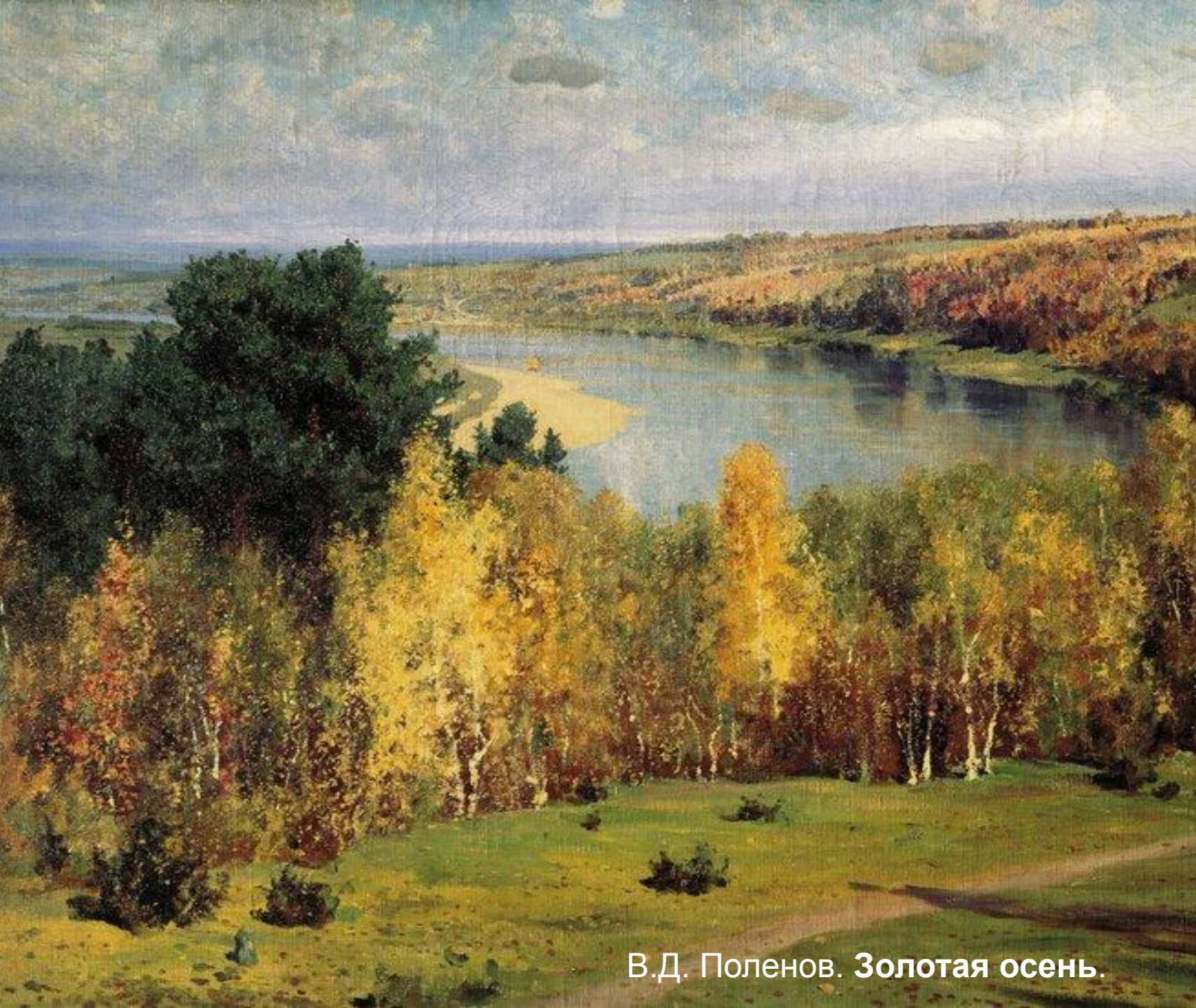
В.Д. Поленов. Золотая осень.