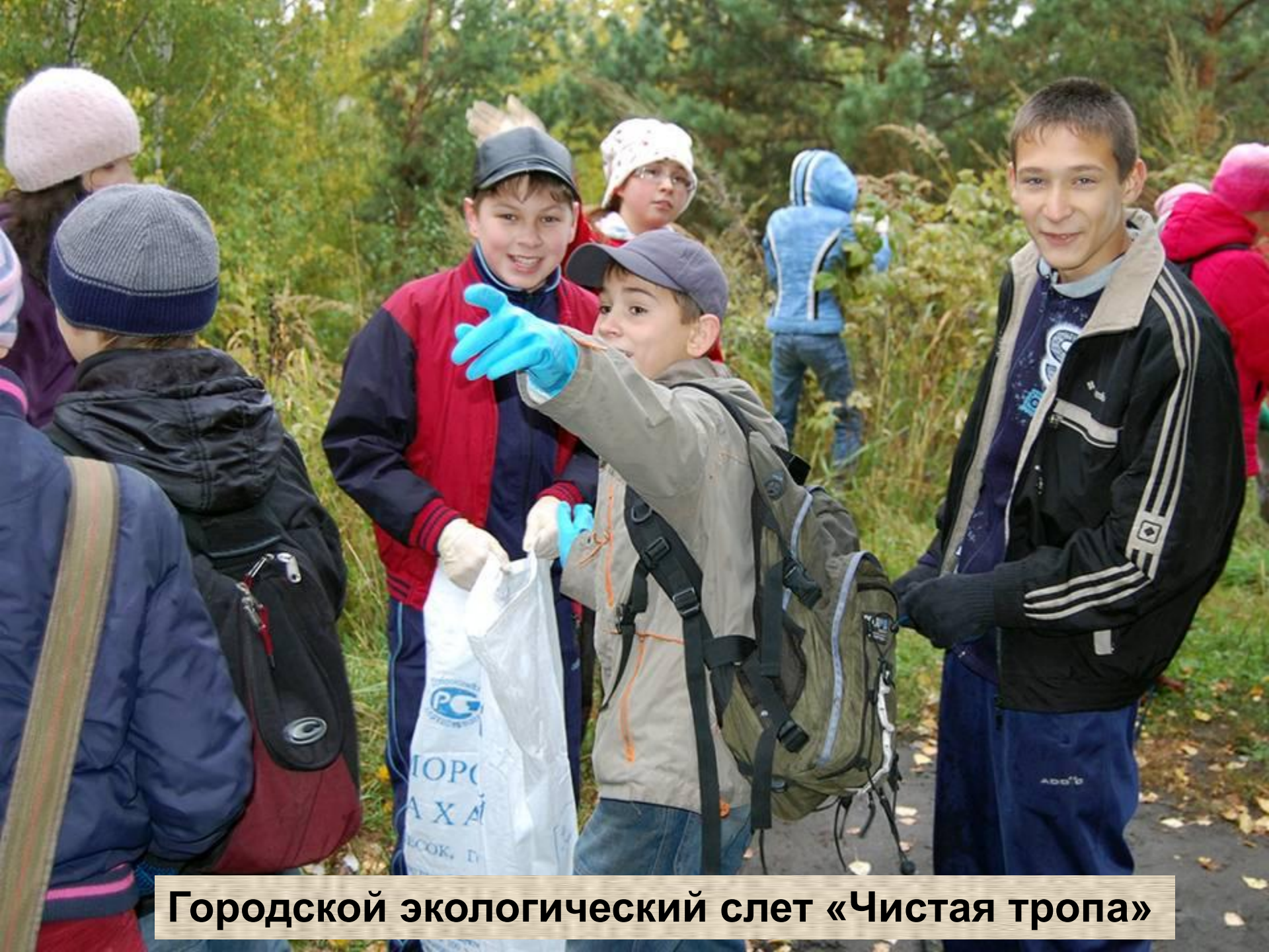
Городской экологический слет «Чистая тропа»