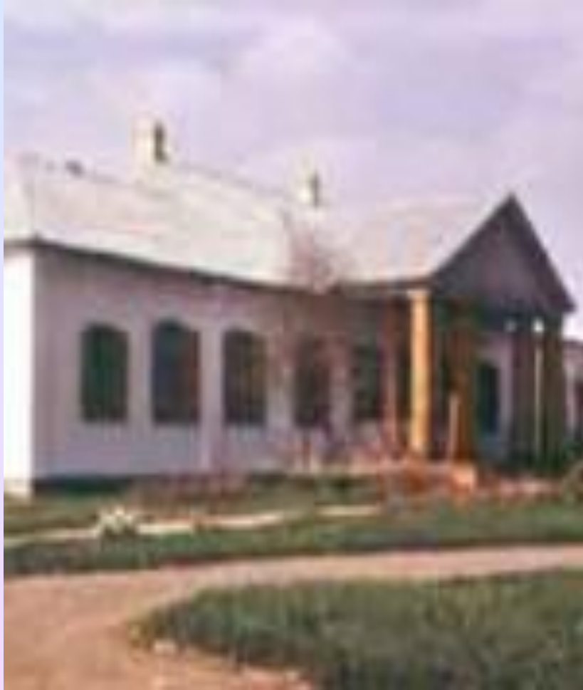
Здесь жил Николай Васильевич