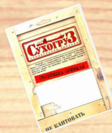
Ставридка сушеная (18г, 36г, 70г)