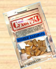
Кубики кальмара (18г, 36г)