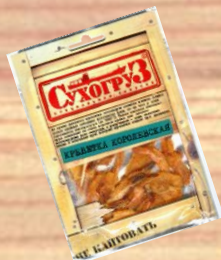
Креветка королевская (18г)