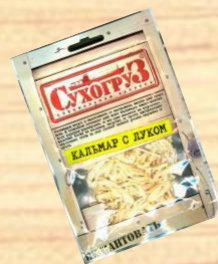
Кальмар с луком (18г)