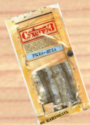
Рыба - игла (18г, 36г)