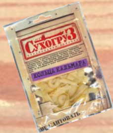
Кольца кальмара (18г, 36г, 70г)