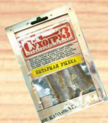
Янтарная рыбка (18г, 36г, 70г)

Закуски из морепродуктов под торговой маркой "Сухогруз" расфасованы в полимерные пакеты по 18 грамм и упакованы в картонные коробки по 100 пачек. Внутри коробки каждые 10 пачек упакованы в полимерную пленку. Срок хранения 12 месяцев при температуре до +25С.