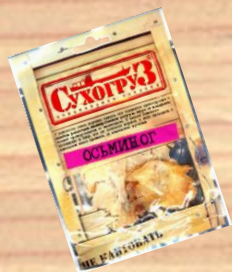
Осьминог сушеный (18г)