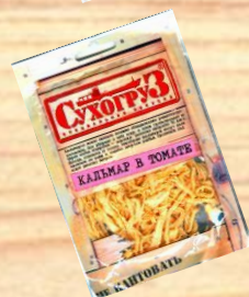
Кальмар в томате (18г)