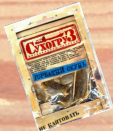
Горбчатый окунь (18г, 36г, 70г)