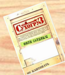
Филе сардины (18г)