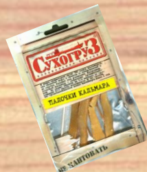
Палочки кальмара (18г, 36г)