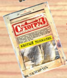
Желтый полосатик (18г, 36г, 70г)