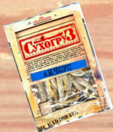
Анчоус сушеный (18г, 36г, 70г)