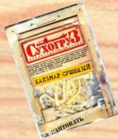
Кальмар сушеный (18г, 36г, 70г)