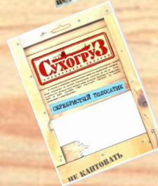
Серебристый полосатик (18г, 70г)