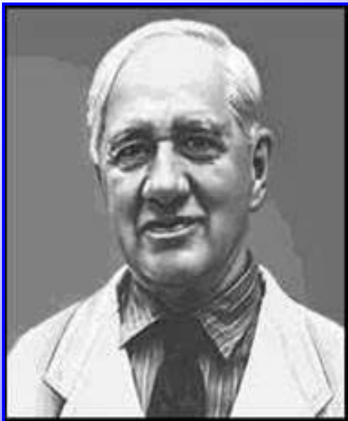
Корней Иванович Чуковский