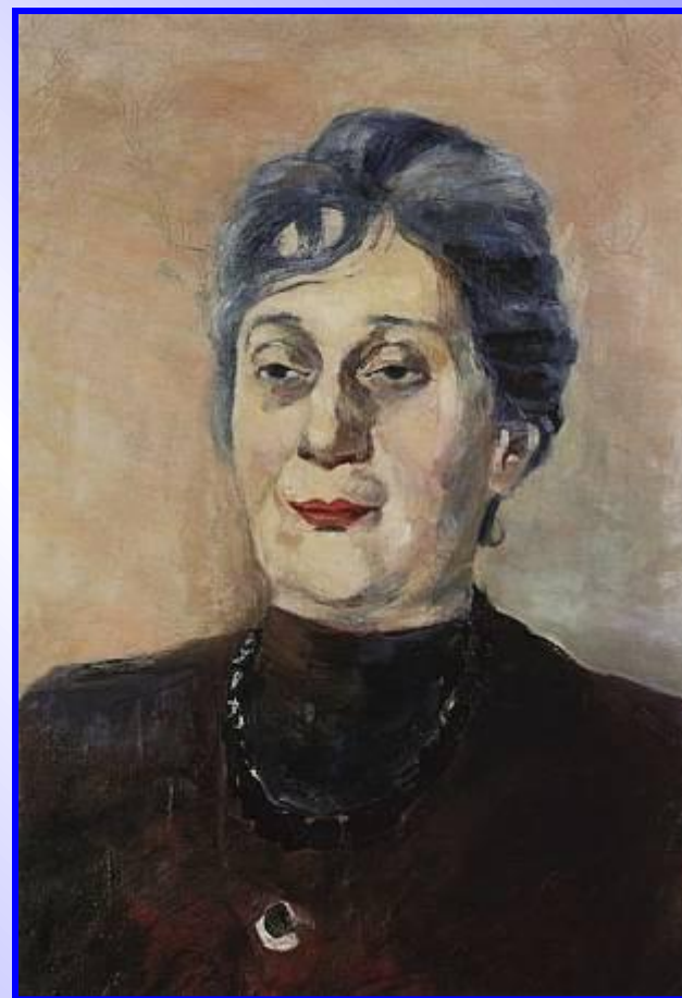
Анна Андреевна Ахматова