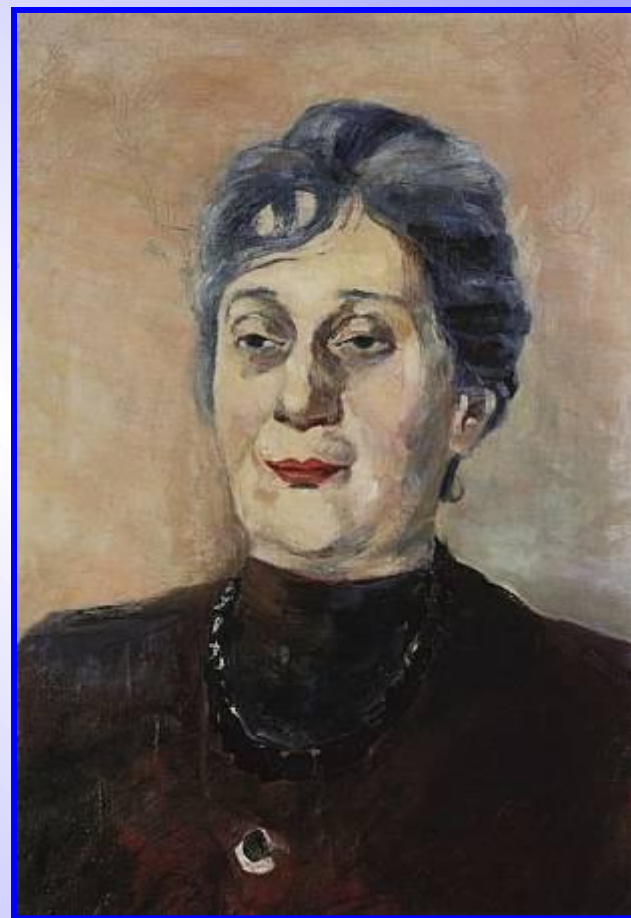
Анна Андреевна Ахматова