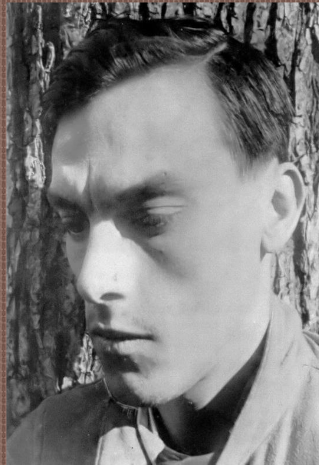
ТАРКОВСКИЙ АРСЕНИЙ АЛЕКСАНДРОВИЧ