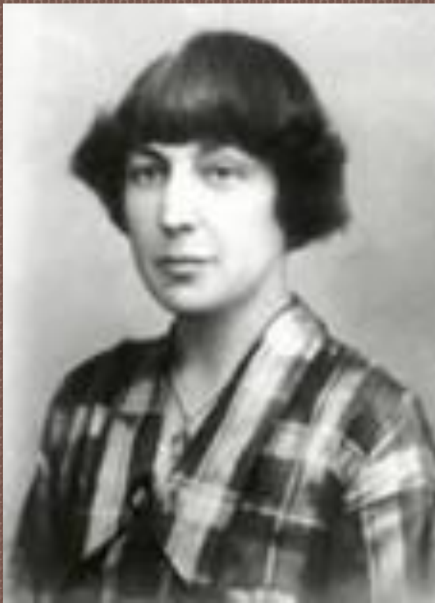
ЦВЕТАЕВА МАРИНА ИВАНОВНА