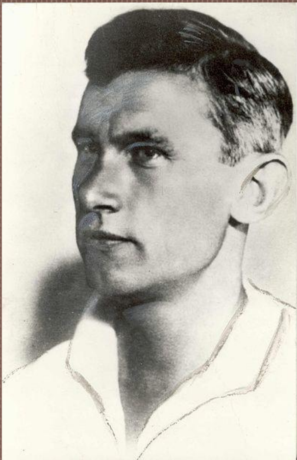
ФАДЕЕВ АЛЕКСАНДР АЛЕКСАНДРОВИЧ