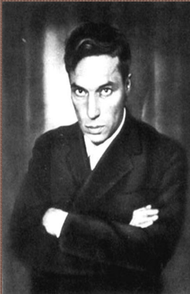
ПАСТЕРНАК БОРИС ЛЕОНИДОВИЧ