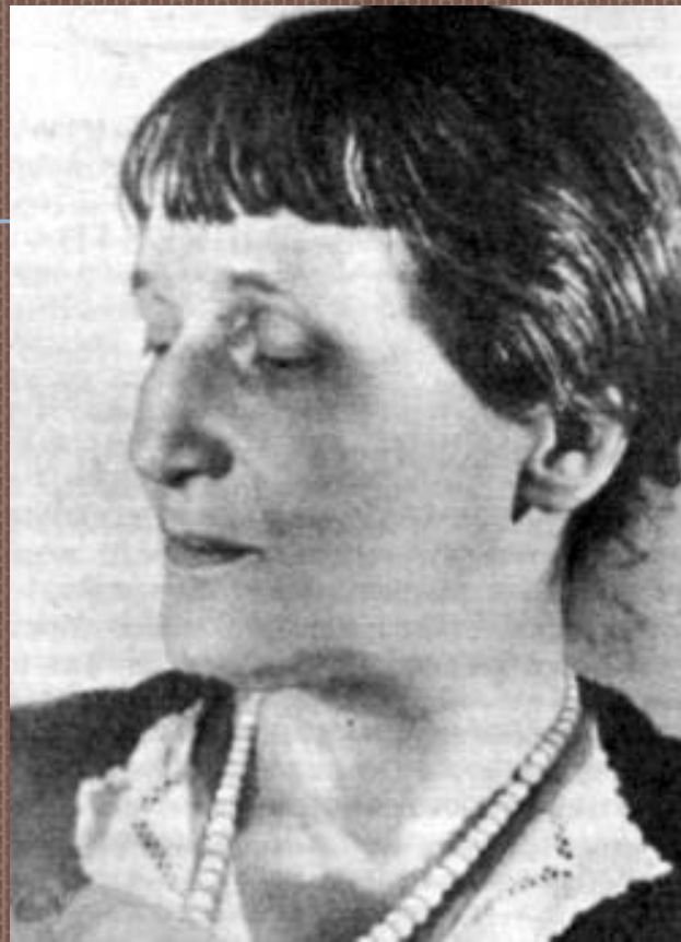
АХМАТОВА АННА АНДРЕЕВНА