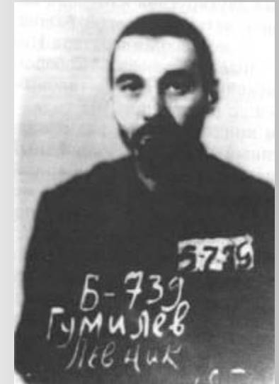
Из дела осужденного Гумилева Л.Н.