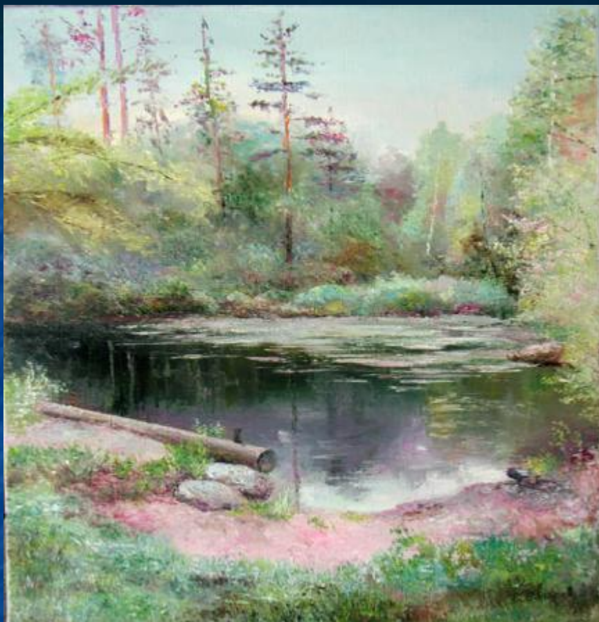
Владимир Картин «Лесное озеро»