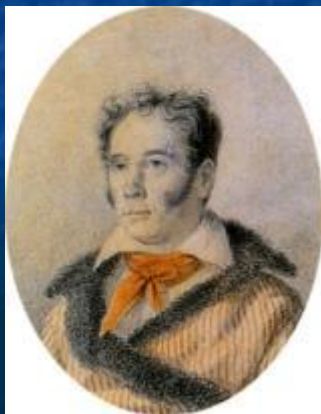
И. Козлов «Вечерний звон»