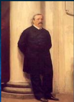
А. Бородин «Богатырская симфония»