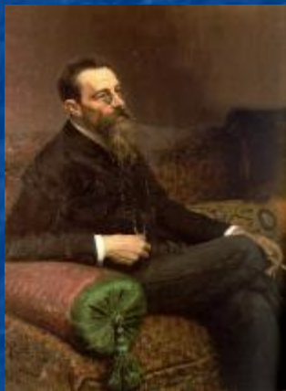
Н. Римский-Корсаков опера «Сказка о царе Салтане », «Три чуда»