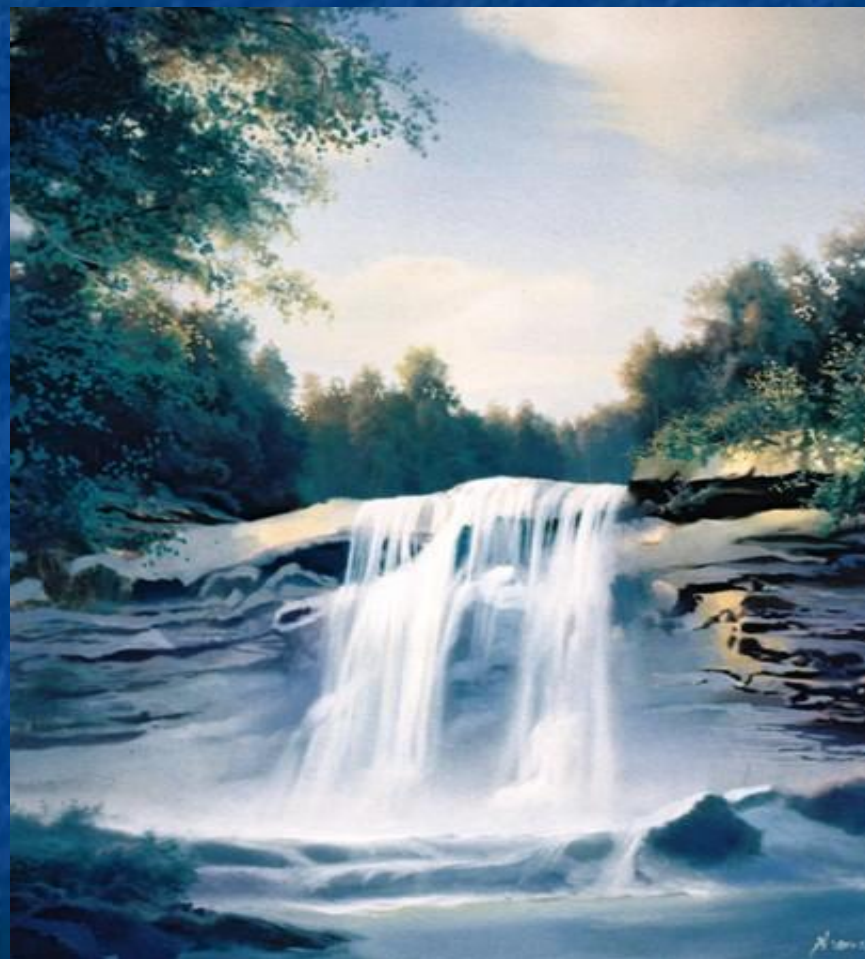
Вадим Секацкий «Водопад»