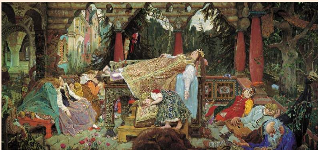
Спящая царевна, 1926