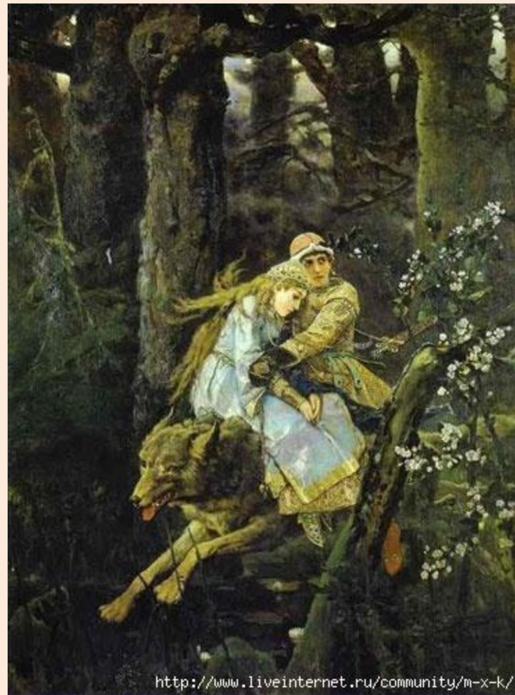
«Иван-царевич на сером волке». 1889

Г) (В)верху деревья переплелись ветвями, сквозь которые (редко) редко пробивается солнечный луч.