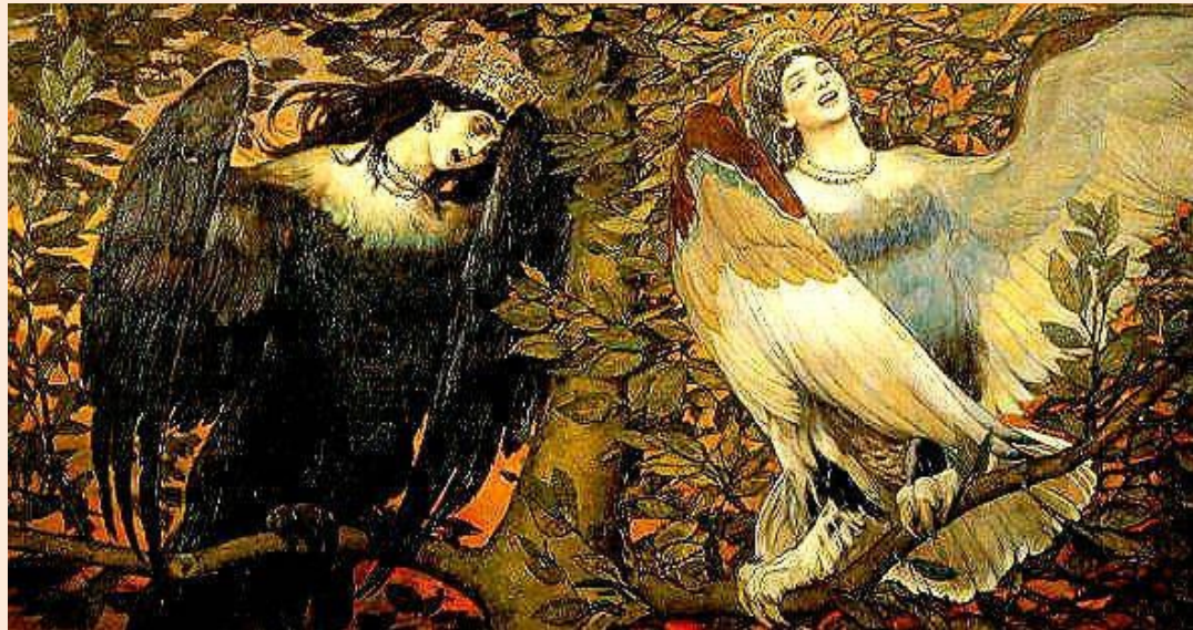
Песнь радости и печали, 1898

Многие наречные выражения требуют обращения к словарю и запоминания!