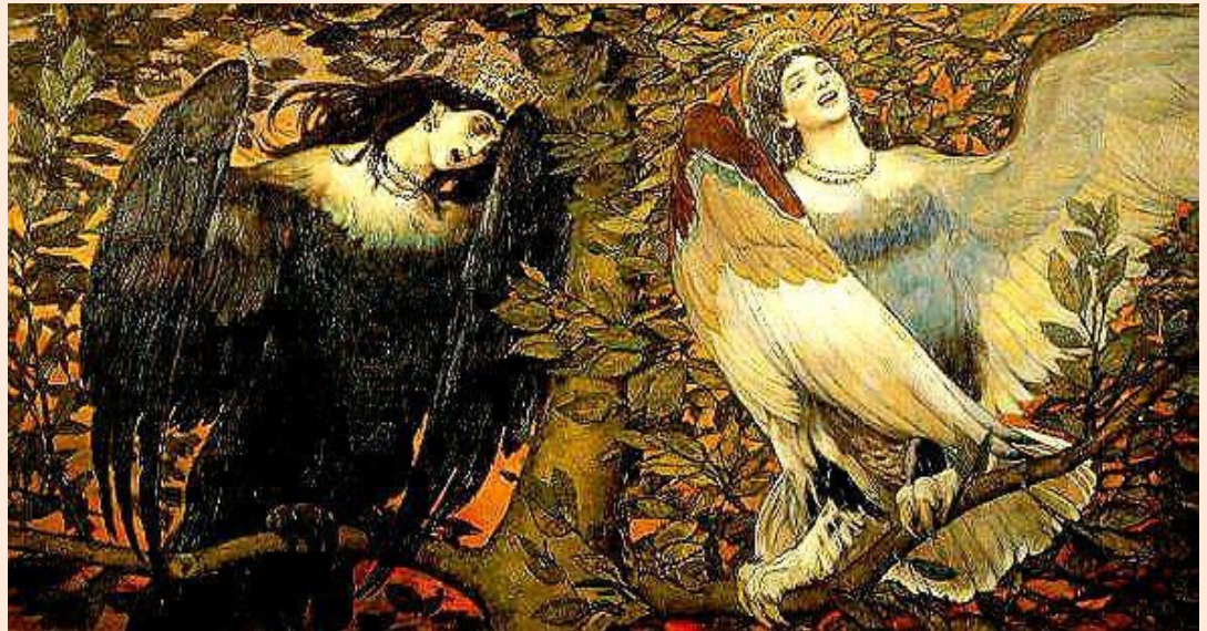
Песнь радости и печали, 1898

Многие наречные выражения требуют обращения к словарю и запоминания!