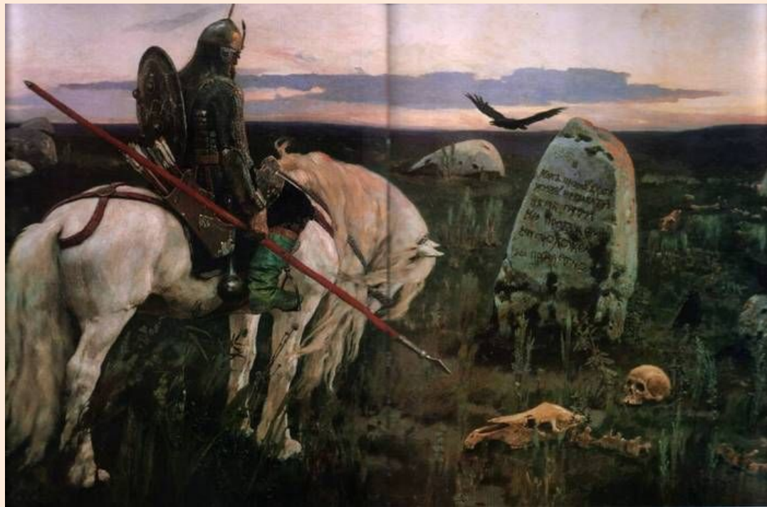
«Витязь на распутье». 1882