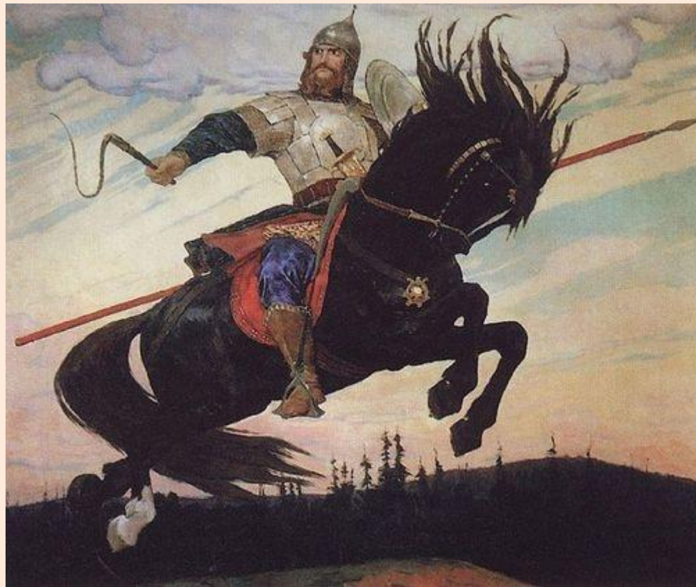
Богатырский галоп, 1914

Г) Зорко высматривает богатырь с копьём (на)изготовку врагов родной земли.