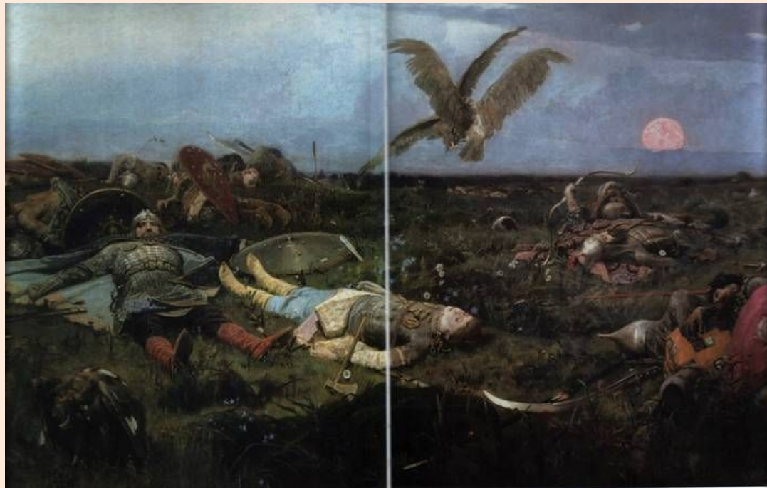
«После побоища Игоря Святославича с половцами». 1880