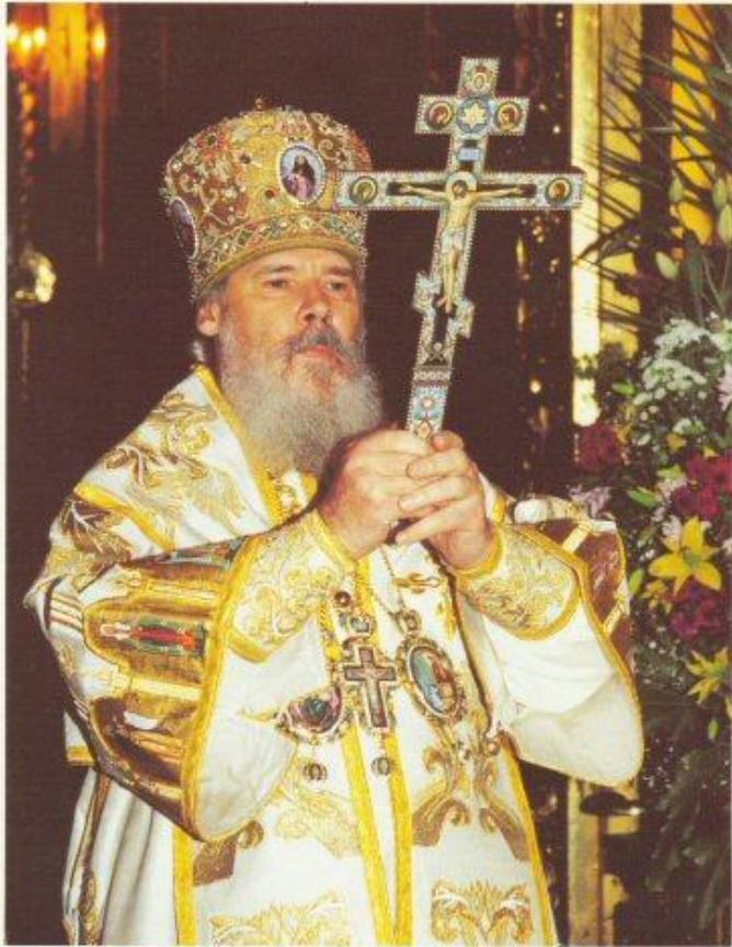
Святейший Патриарх Московский и всея Руси АЛЕКСИЙ II

Облачение священника свидетельствует о наложении на себя сугубого креста, креста молитвенных трудов во имя Христа.