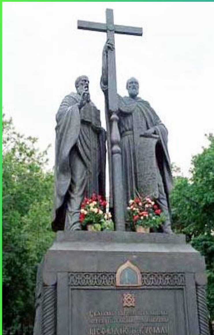
Памятник Кириллу и Мефодию, г. Москва

И ложилась букв славянских вязь, И строка бежала за строкою Книгою великой становясь, Посланной Всевышнею рукою.