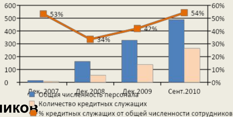
Динамика общей численности сотрудников и кредитных служащих