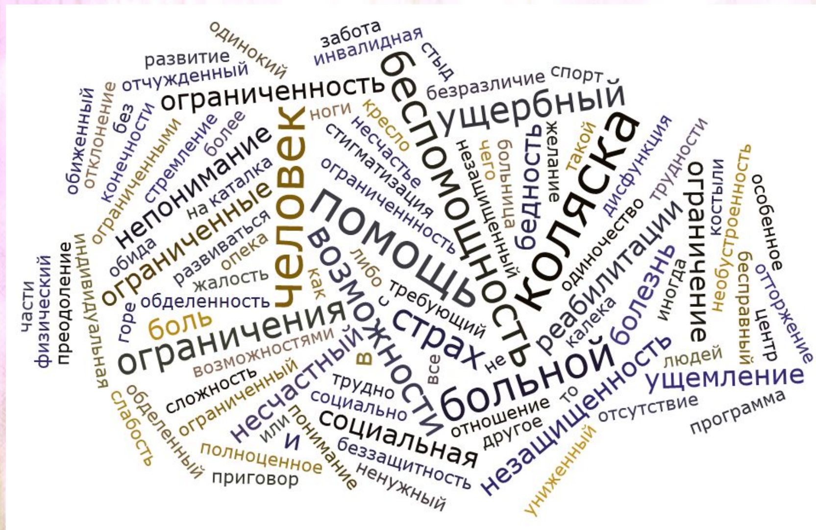
Ассоциации со словом «ИНВАЛИД» ДО просмотра