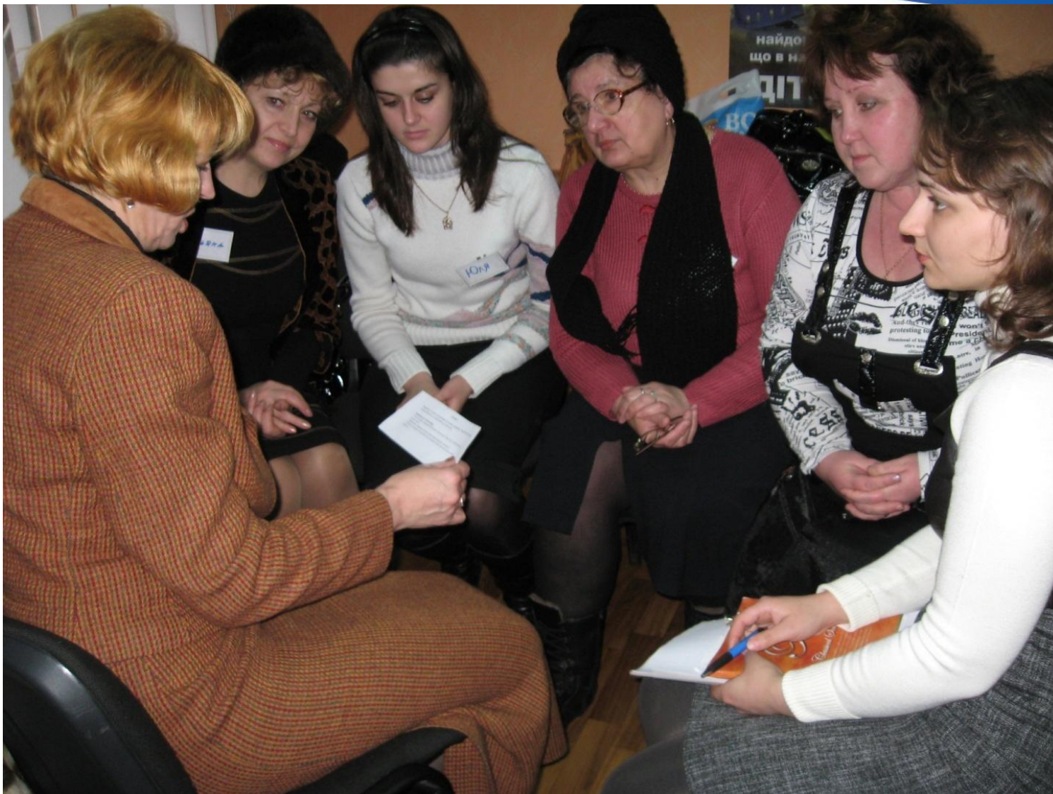
Тренинг для учителів