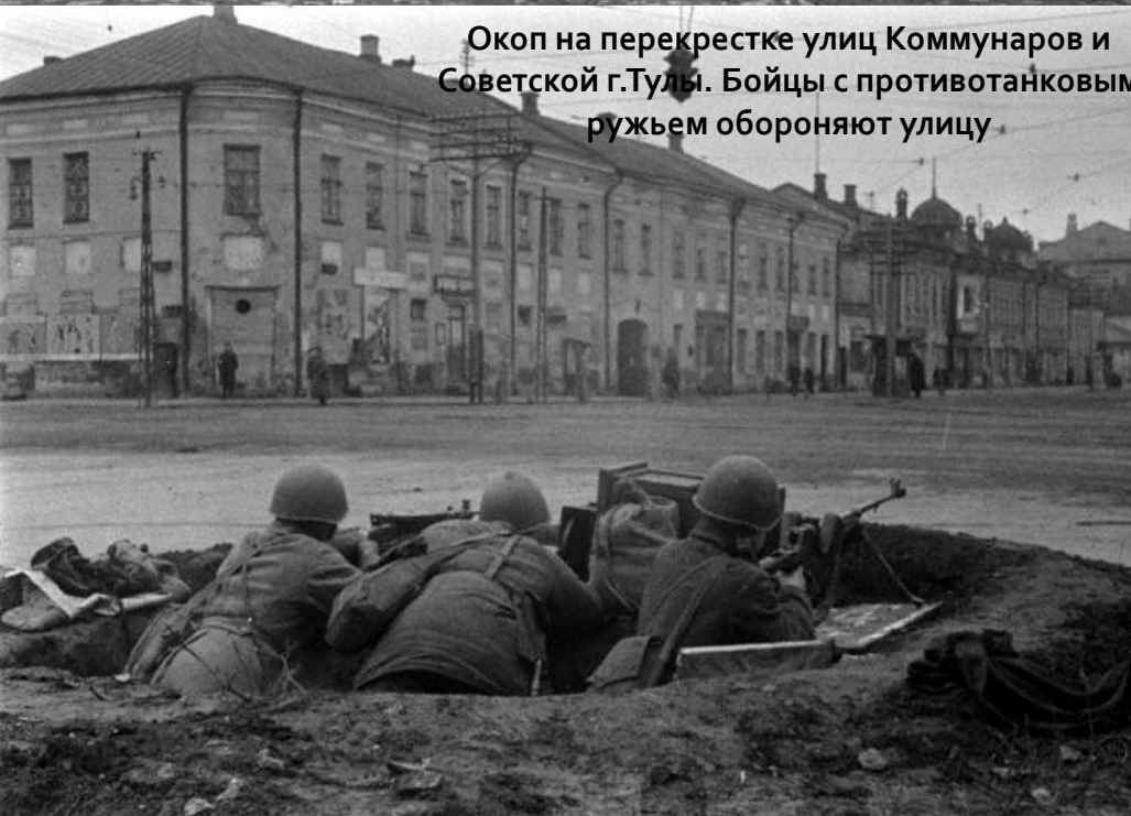
Окоп на перекрестке улиц Коммунаров и Советской г.Тулы. Бойцы с противотанковым ружьем обороняют улицу