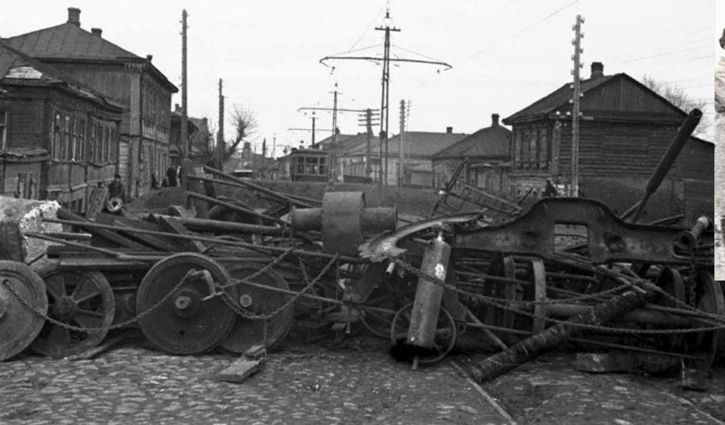
Баррикады на одной из улиц Тулы в дни обороны