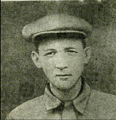
Герой Советского Союза АЛЕКСАНДР ЧЕКАЛИН

Клятва партизан : «Я, гражданин великого Советского Союза, верный сын героического русского народа, клянусь, что не выпущу из рук оружия, пока последний фашистский гад на нашей земле не будет уничтожен...»