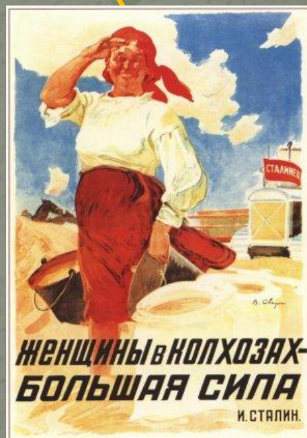
388. Сварог В. Женщины в колхозах — большая сила. И. Сталин, 1935