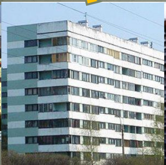
Однотипная застройка кварталов домами типа «коробка»