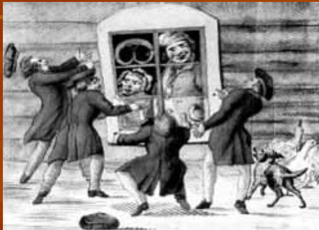
Рисунок из журнала «Лицейский мудрец»