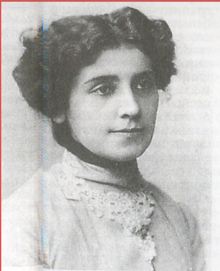
актриса - Наталья Волохова