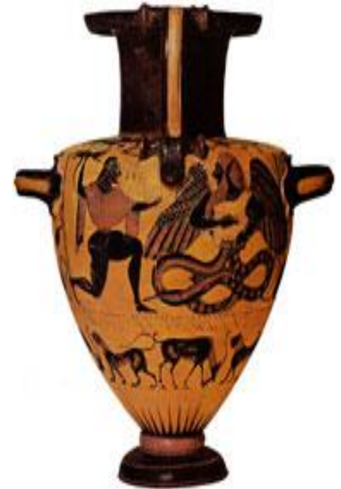
Битва Зевса Битва Зевса с Тифоном