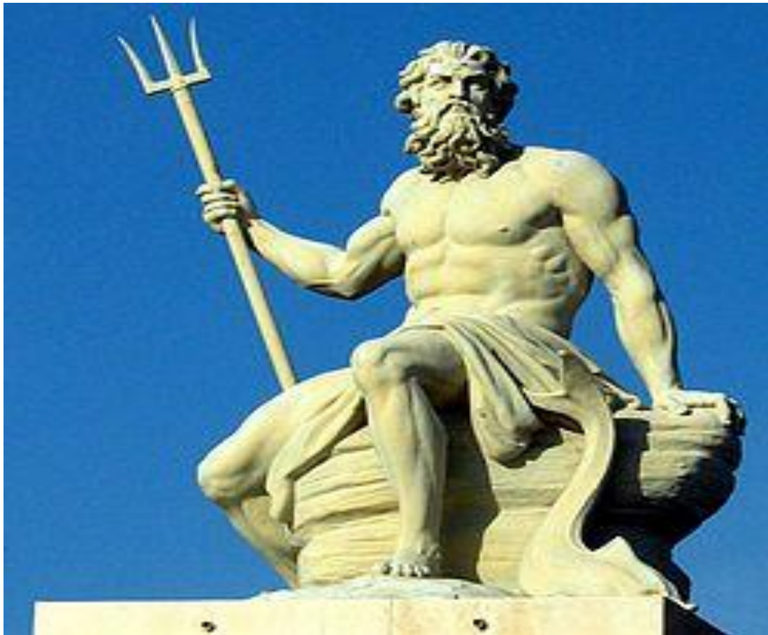
Посейдон (бог морей). Копенгаген. 2005.