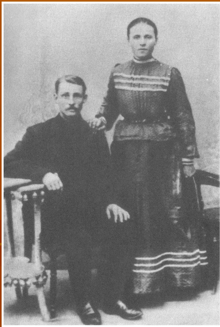
Родители поэта - потомственные рязанские хлеборобы