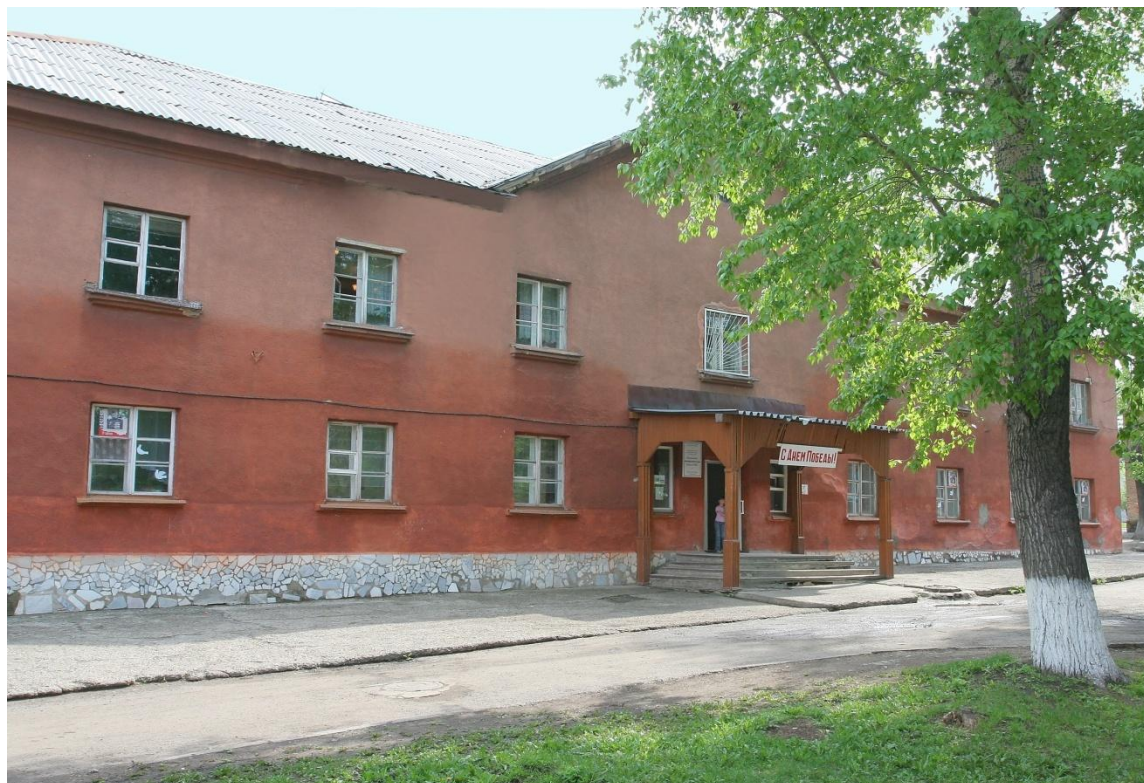
Муниципальное общеобразовательное учреждение «Начальная общеобразовательная школа №63»