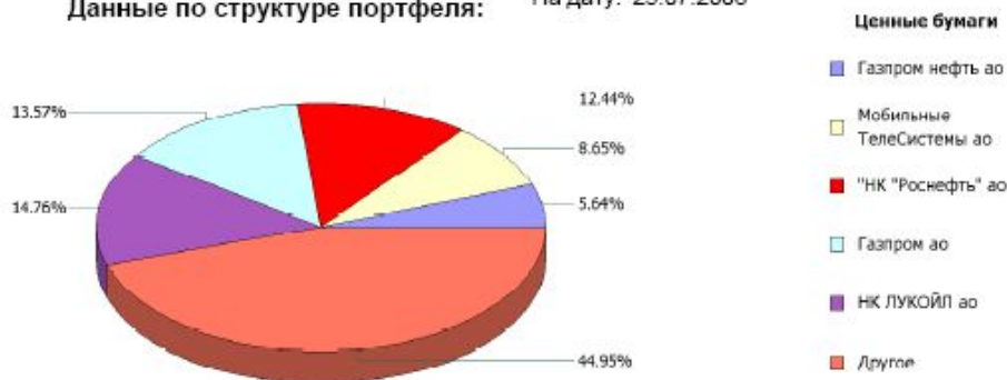
Данные по структуре портфеля: На дату: 25.07.2008

▶ 2007 Премия «Финансовый Олимп», в номинации «Популярный ПИФ», РБК. ▶ 2005 Премия «Финанс.» - «Лучший среди фондов акций», журнал «Финанс.»