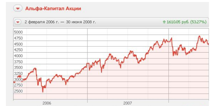
Данные по структуре портфеля: На дату: 25.07.2008

▶ 2007 Премия «Финансовый Олимп», в номинации «Популярный ПИФ», РБК. ▶ 2005 Премия «Финанс.» - «Лучший среди фондов акций», журнал «Финанс.»