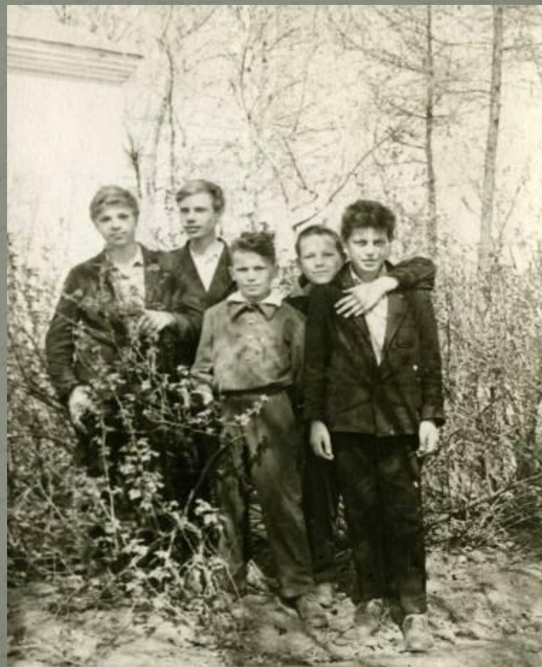
Выпускники 41-го у стен родной школы.

В этом десятом классе было 27 человек. Три года подряд, 1939-1941, он был самым старшим классом во всей школе. Это первый выпуск 61 школы, до этого она была семилетней.