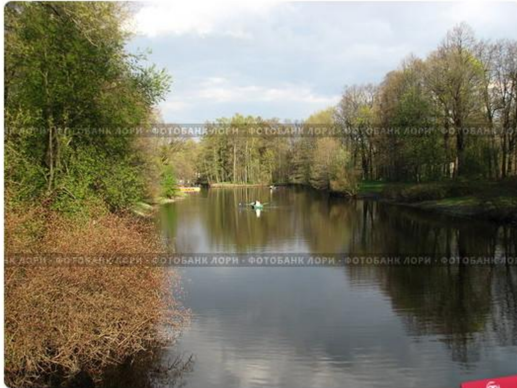
Весенний пейзаж. Елагин остров. Санкт-Петербург.