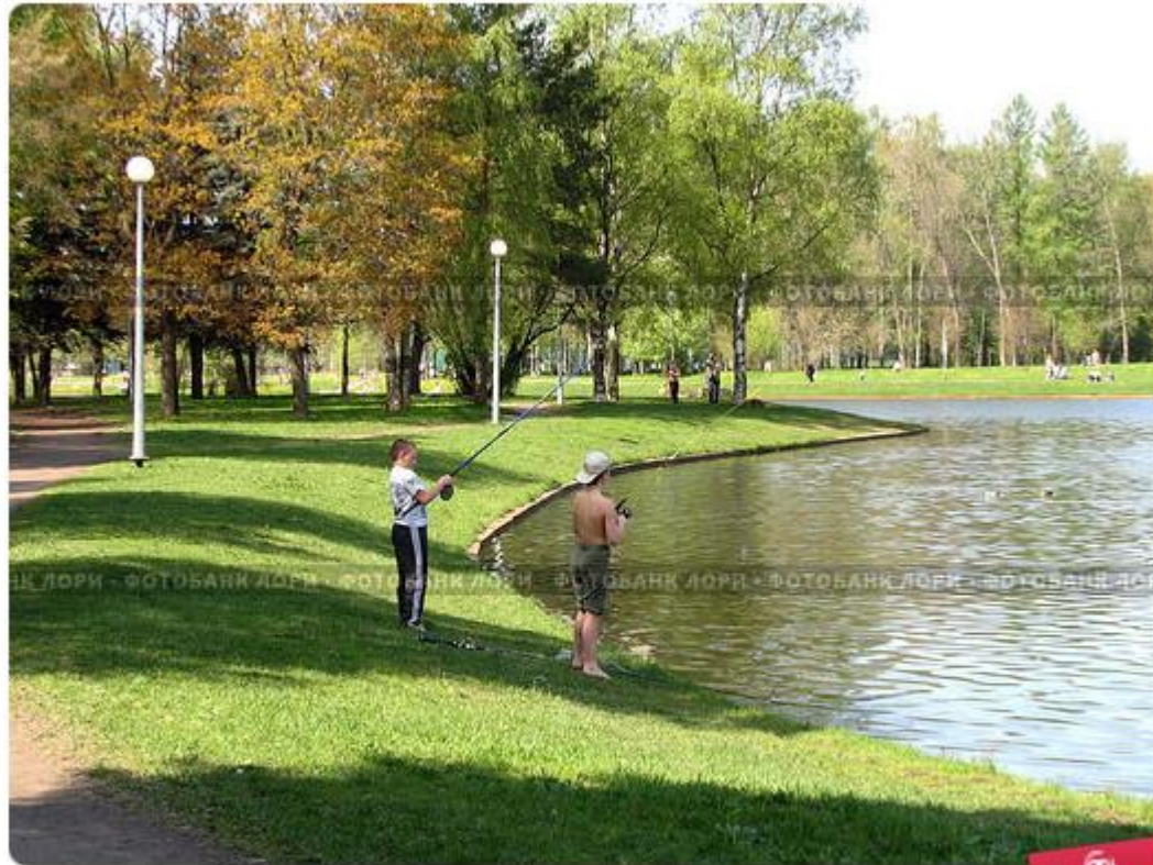
Мальчики-рыболовы на берегу Южного пруда в Приморском парке Победы.