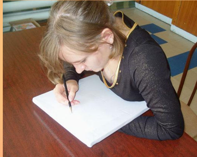
Рисунок нужно наносить осторожно, без лишних штрихов и исправлений: ткань – не бумага: ластиком не сотрешь