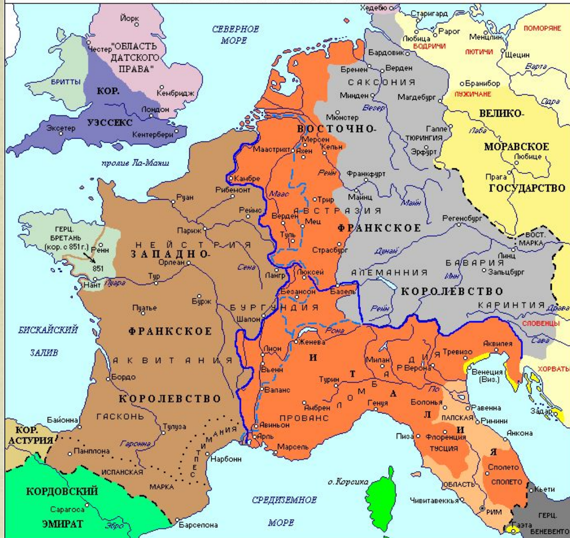
Королевства и их границы после заключения Верденского договора 843 г.