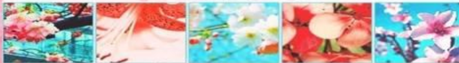
spring is love