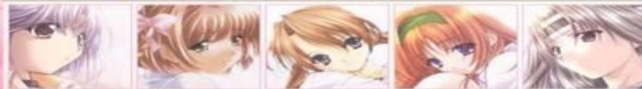
ANIME IS LOVE