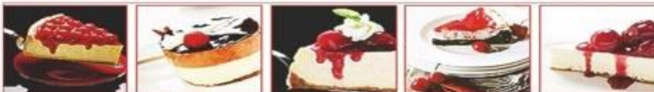
CHEESECAKE IS LOVE