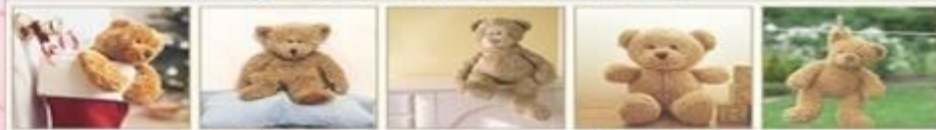
TEDDY BEARS ARE LOVE