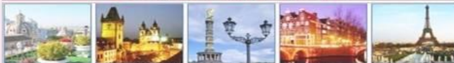
EUROPE IS LOVE