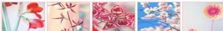
FLOWERS ARE LOVE