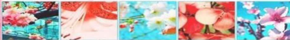
spring is love