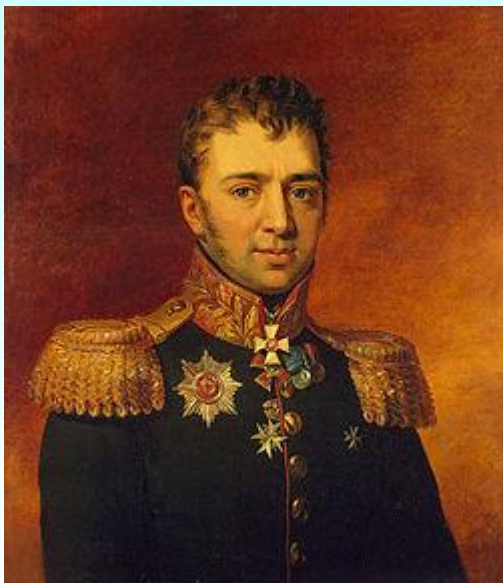
Лихачёв Пётр Гаврилович