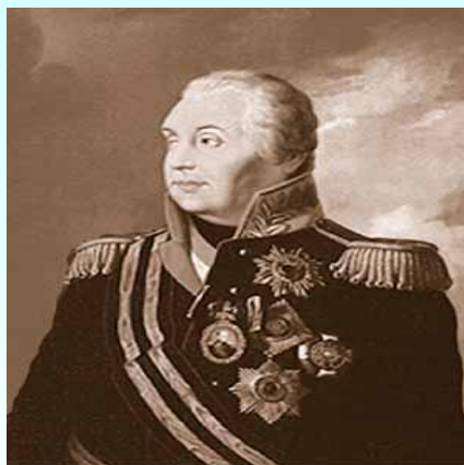
Кутузов Михаил Илларионович Кутузов Михаил Илларионович