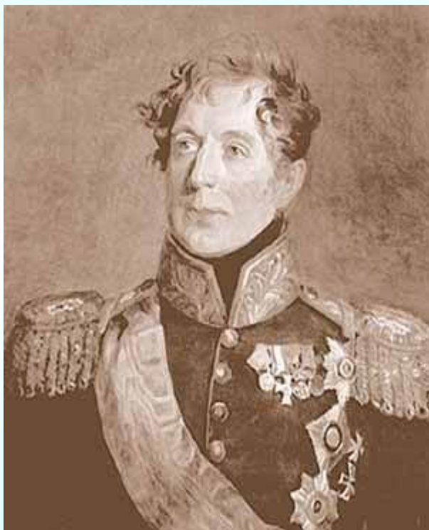
Милорадович Михаил Андреевич (1771-1825), русский генерал от инфантерии

Спокойно закончив трапезу, он вернулся к исполнению своих обязанностей. (Не здесь ли Александр Дюма подсмотрел сюжет знаменитой сцены из «Трех мушкетеров»?)