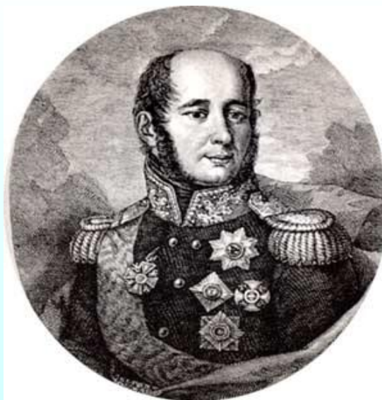
Барклай де Толли Михаил Богданович.