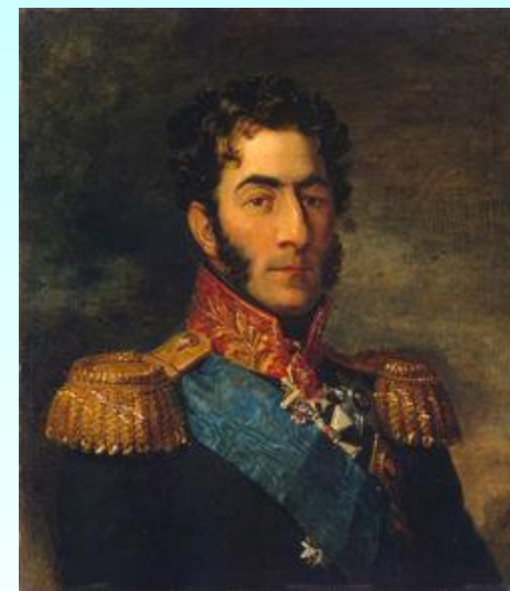
Багратион Петр Иванович