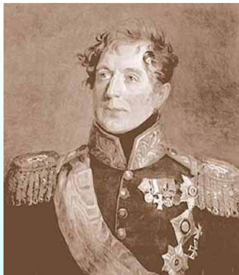
Милорадович Михаил Андреевич