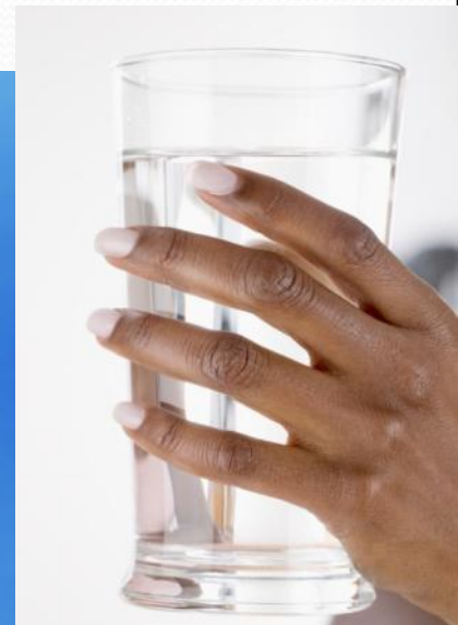
Вода принимает форму сосуда