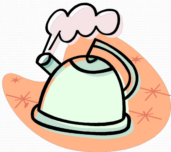
Газообразное состояние воды