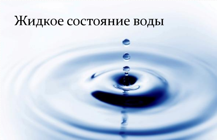
Жидкое состояние воды