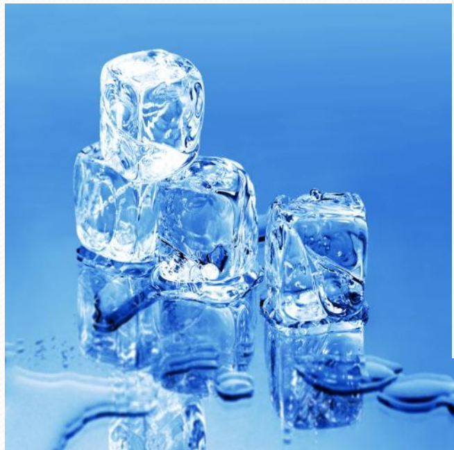
Твердое состояние воды