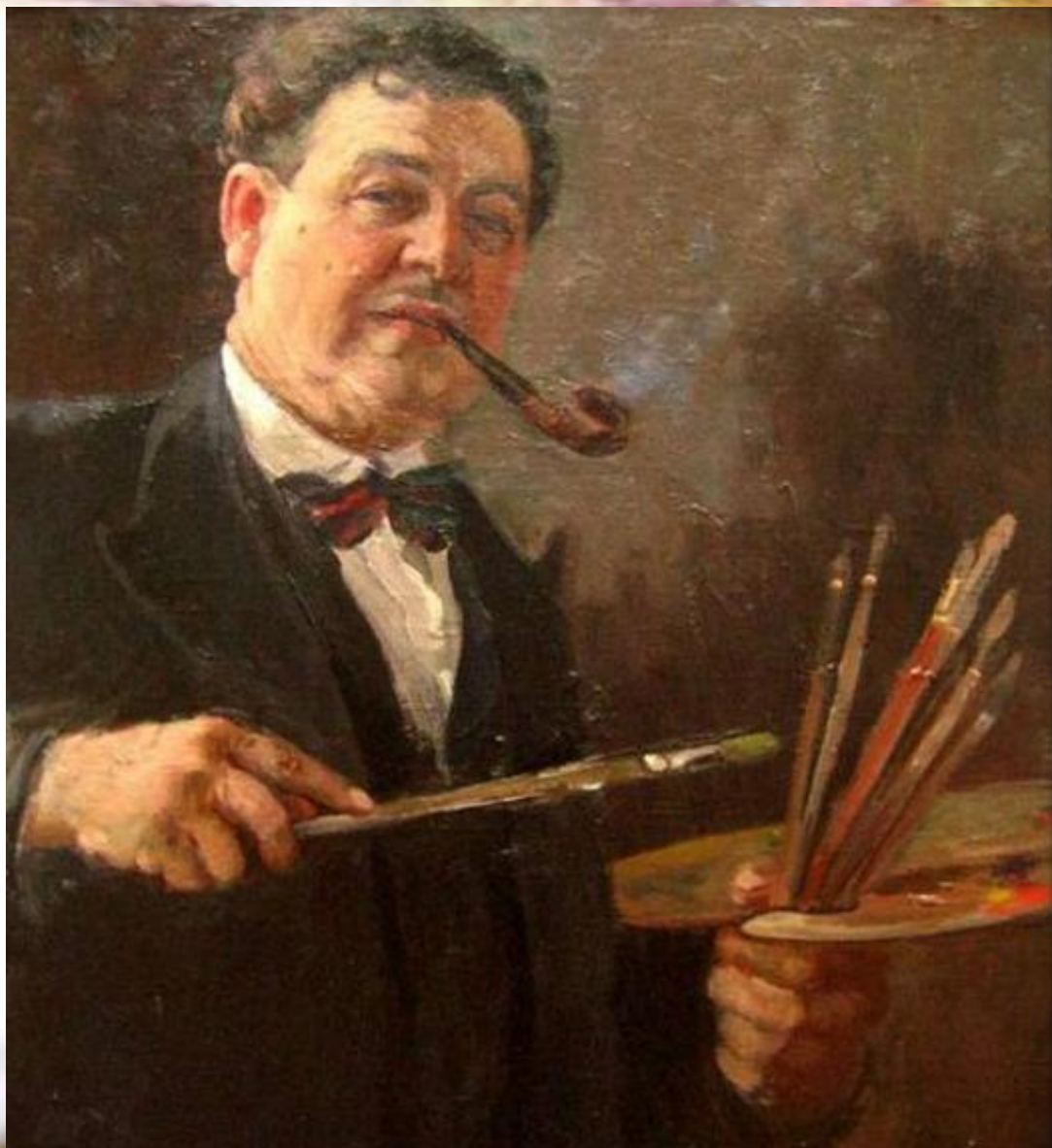
А.М. Герасимов. Автопортрет