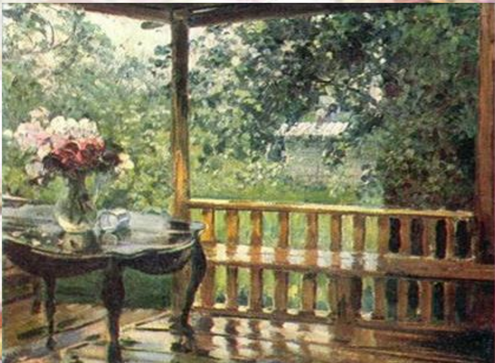
А.М. Герасимов. После дождя (Мокрая терраса)