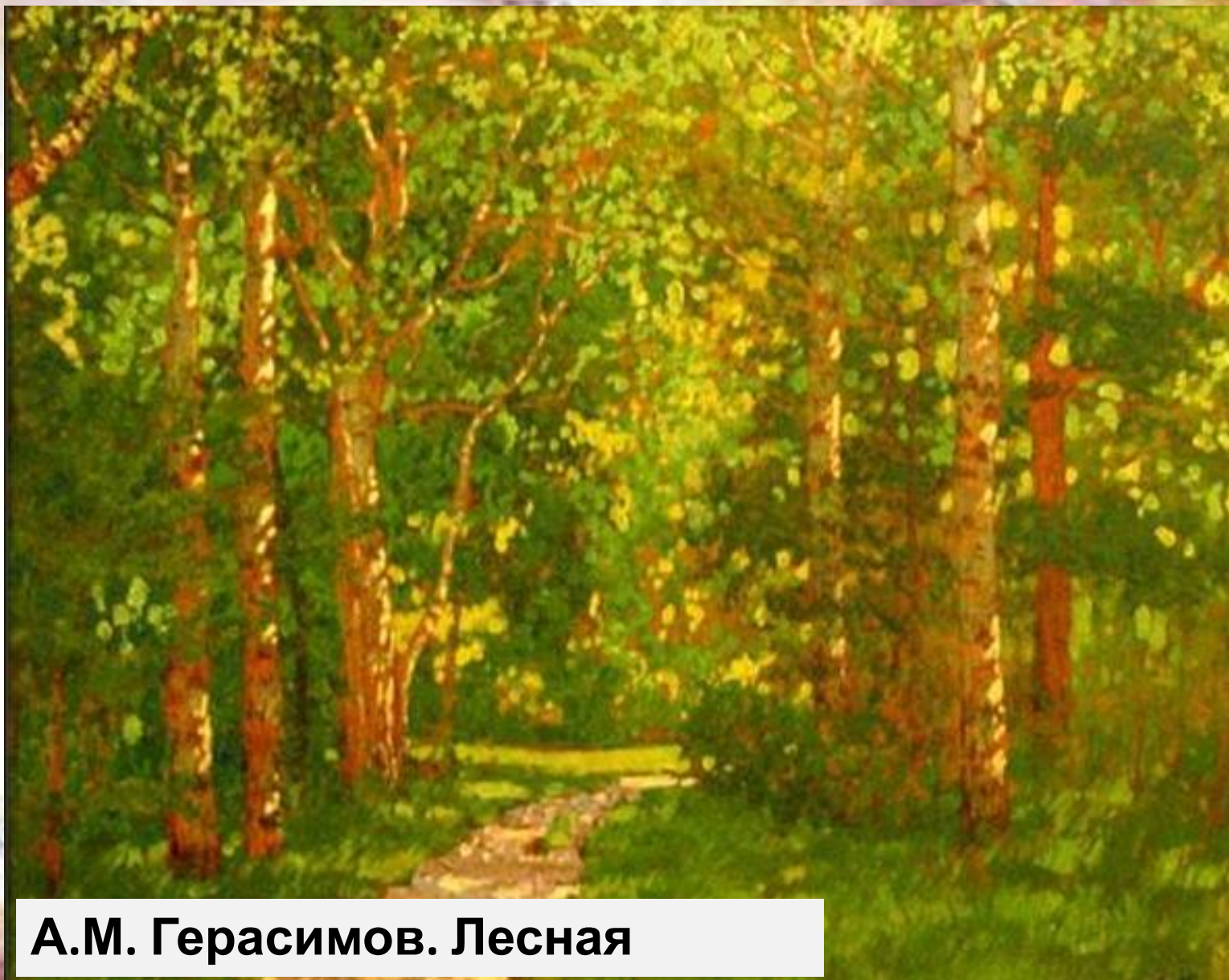
А.М. Герасимов. Лесная тропинка