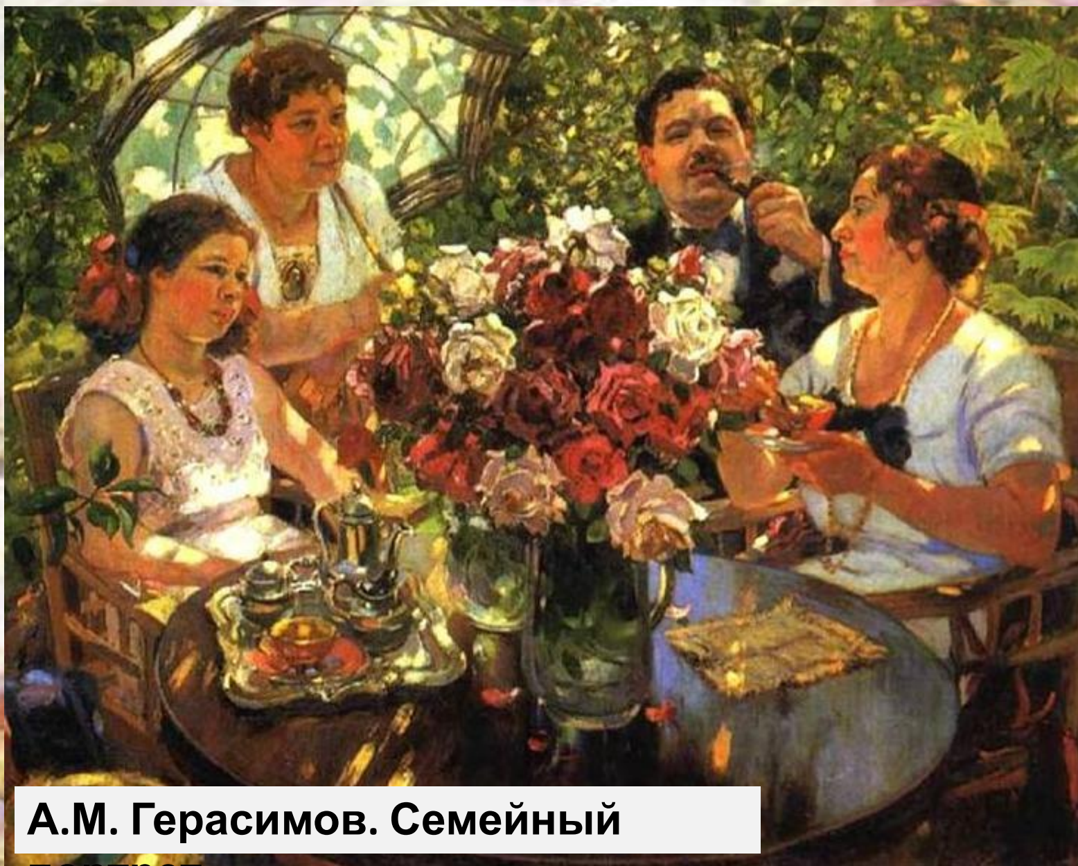
А.М. Герасимов. Семейный портрет.