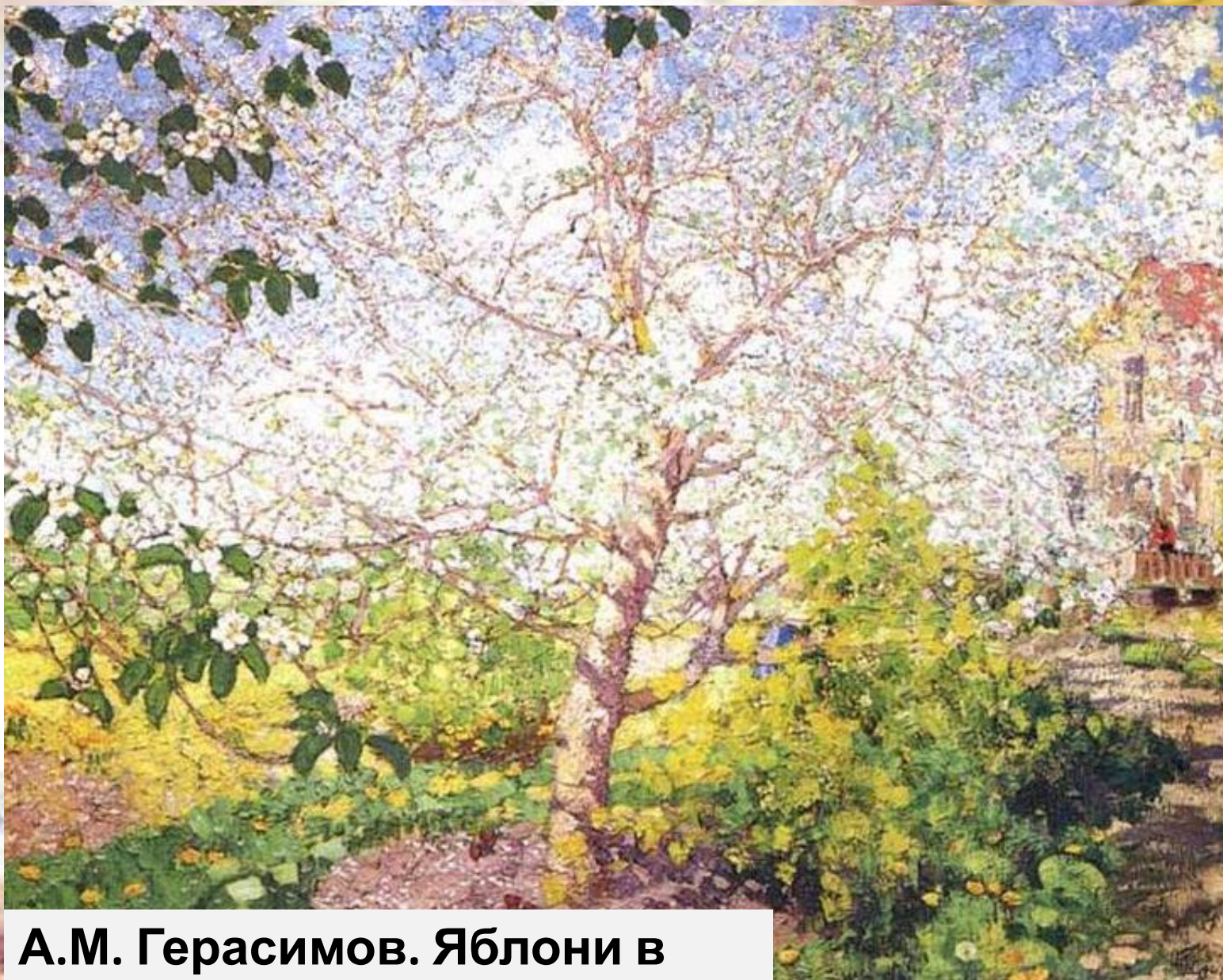
А.М. Герасимов. Яблони в цвету.