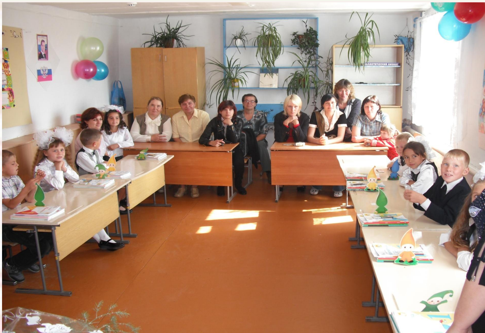
Родители — наши первые помощники