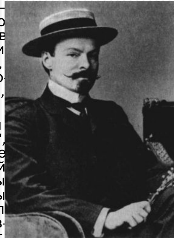
К. Д. Бальмонт