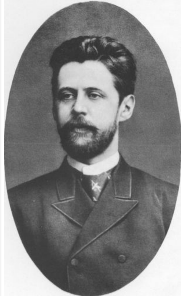
И. Ф. Анненский

И. Ф. Анненский родился в Омске, вскоре семья переехала в Петербург. В автобиографии будущий поэт сообщал, что вырос "в среде, где соединялись элементы бюрократические и помещичьи". "С детства любил заниматься историей и словесностью и чувствовал антипатию ко всему элементарному и банально-ясному". Писать стихи Анненский начал довольно рано. Так как в 1870-е годы понятие "символизм" не было еще ему известно, он называл себя мистиком и "бредил религиозным жанром" испанского художника XVI в. Б. Э. Мурильо, который и "старался „оформлять словами"". Следуя совету своего старшего брата, известного экономиста и публициста Н. Ф. Анненского, считавшего, что до тридцати лет не надо публиковаться, молодой поэт не предназначал свои поэтические опыты для печати. В университетские годы изучение древних языков и античности на время вытеснило стихотворчество; по признанию поэта, он ничего не писал, кроме диссертаций. После университета началась "педагогически-административная" деятельность, которая, по мнению его коллег-античников, отвлекала Анненского от "строгих научных занятий", а по мнению сочувствующих его