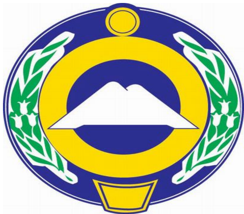
Г е р б