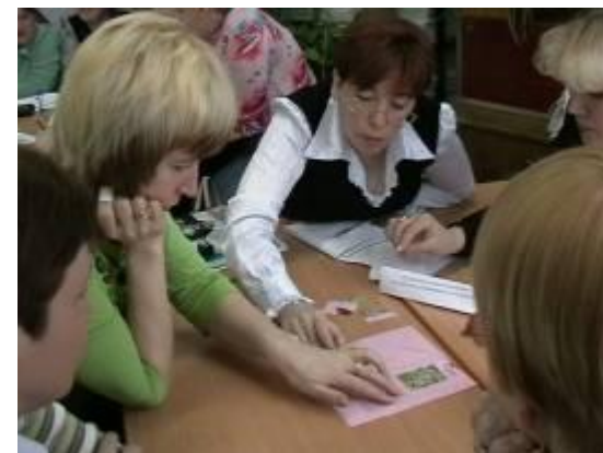
Шухардина Т.А. «Головоломка. Оценивание по инструкции»