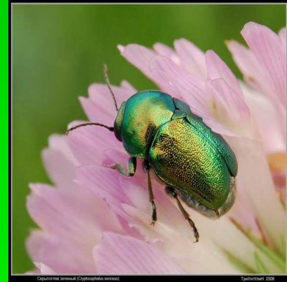
Скритолова зеленая (Scythocorynus viridis)