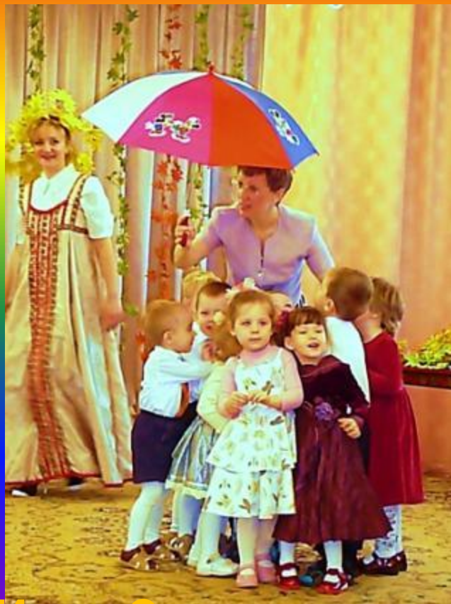
Игра «Солнышко и дождик»