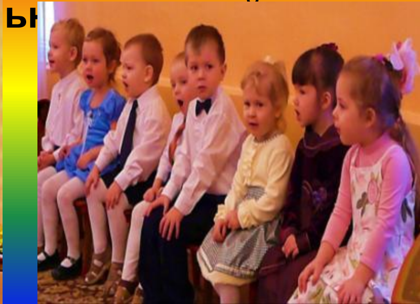
Песня про дождик