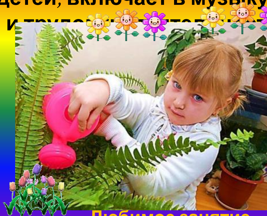
Любимое занятие Марины